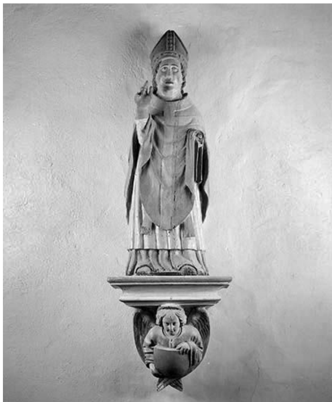
Vue de face avec la console.