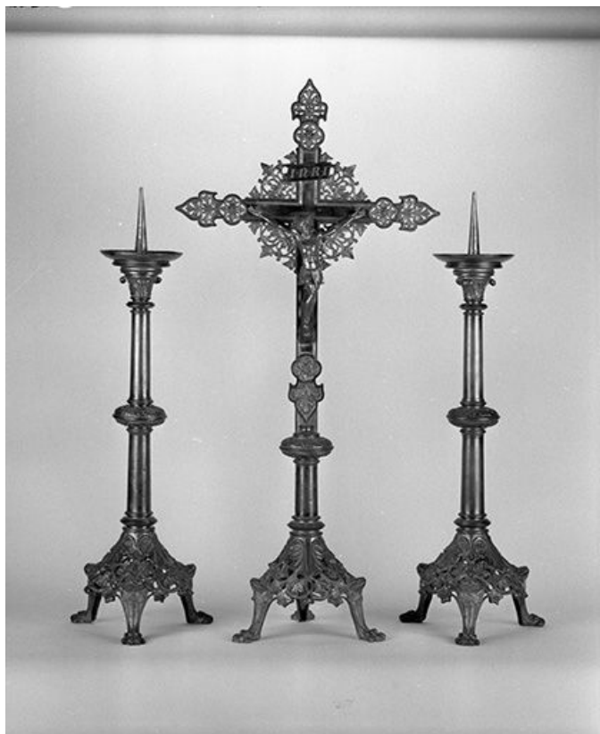
La croix et deux chandeliers.