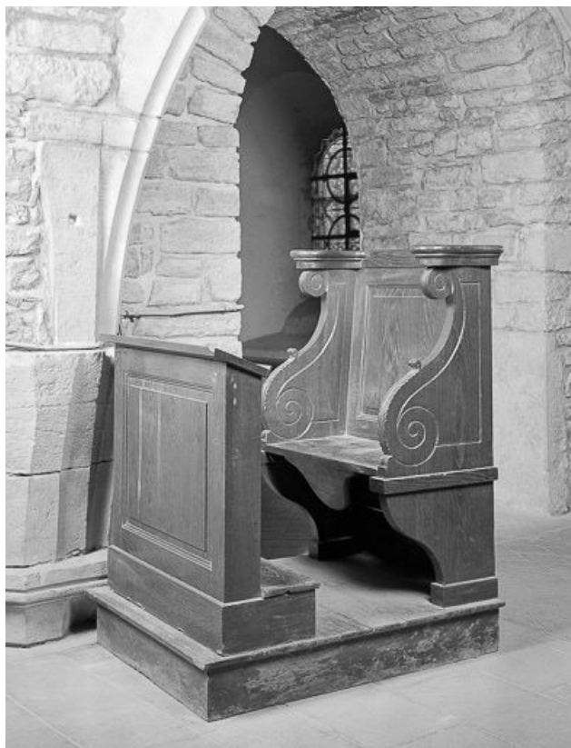
Vue d'une stalle.