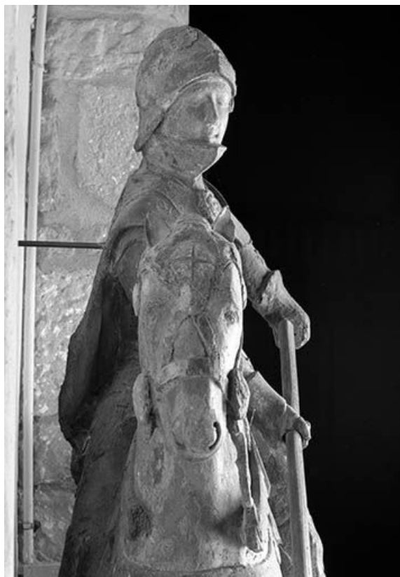
Détail : saint Georges et le cheval vu de face.