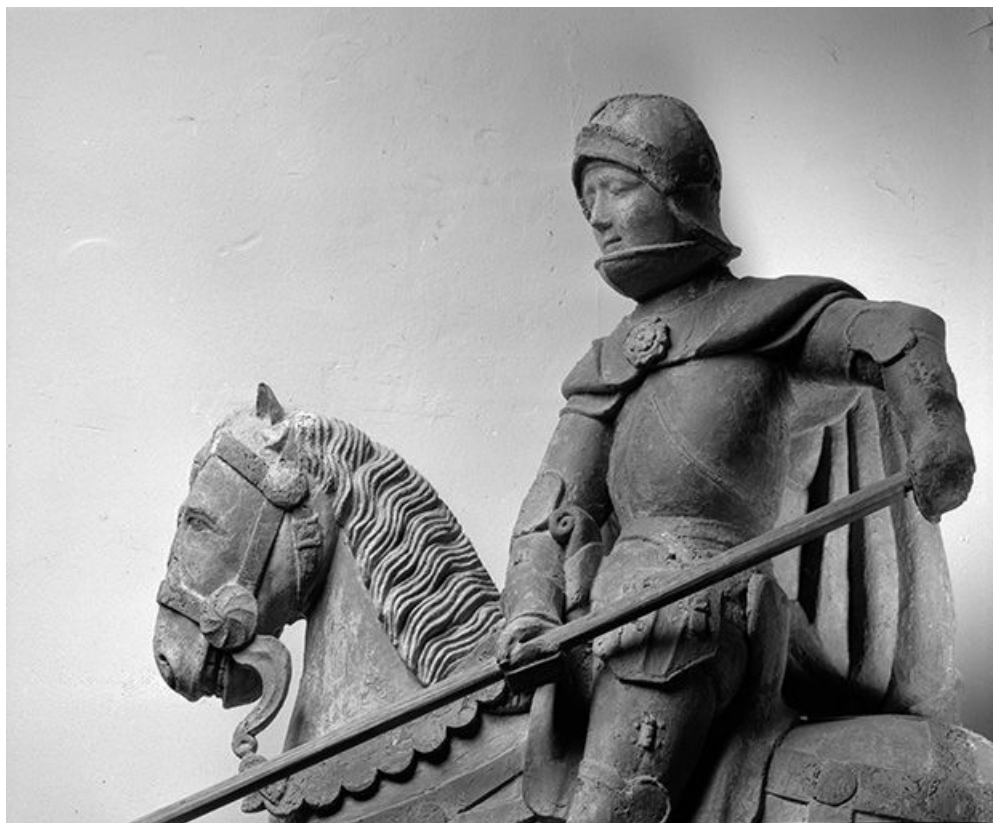
Détail : saint Georges et le cheval vus de trois quarts. 39, Chilly-le-Vignoble