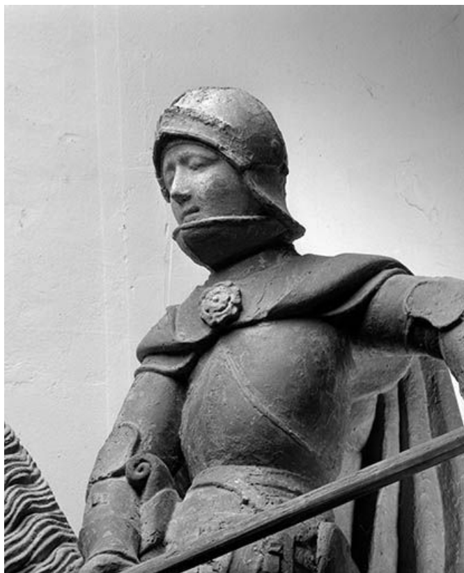
Détail : saint Georges vu de trois quarts. 39, Chilly-le-Vignoble