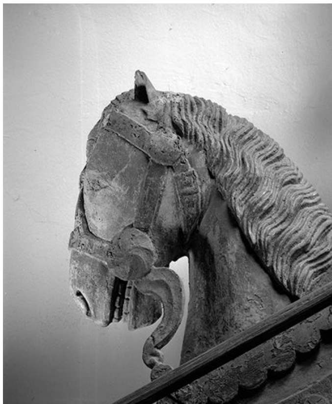
Détail : la tête du cheval vue de profil.