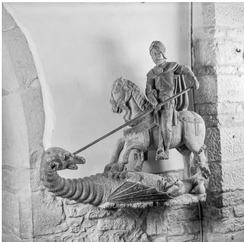
Vue générale de trois quarts.