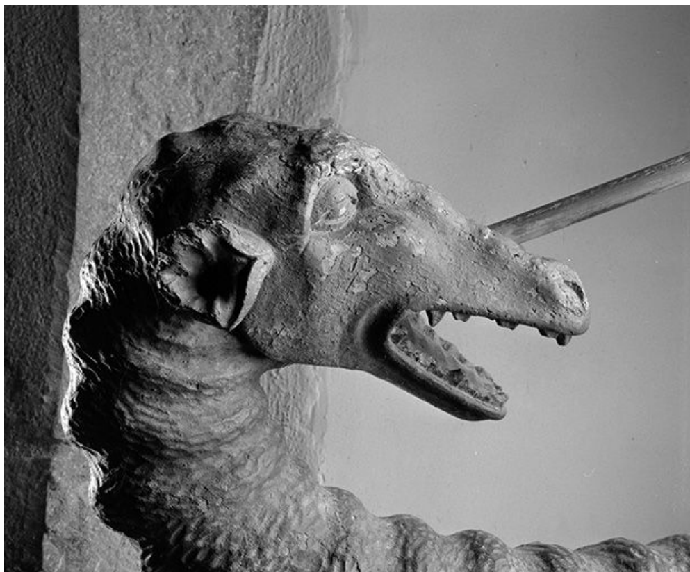
Détail : la tête du dragon.