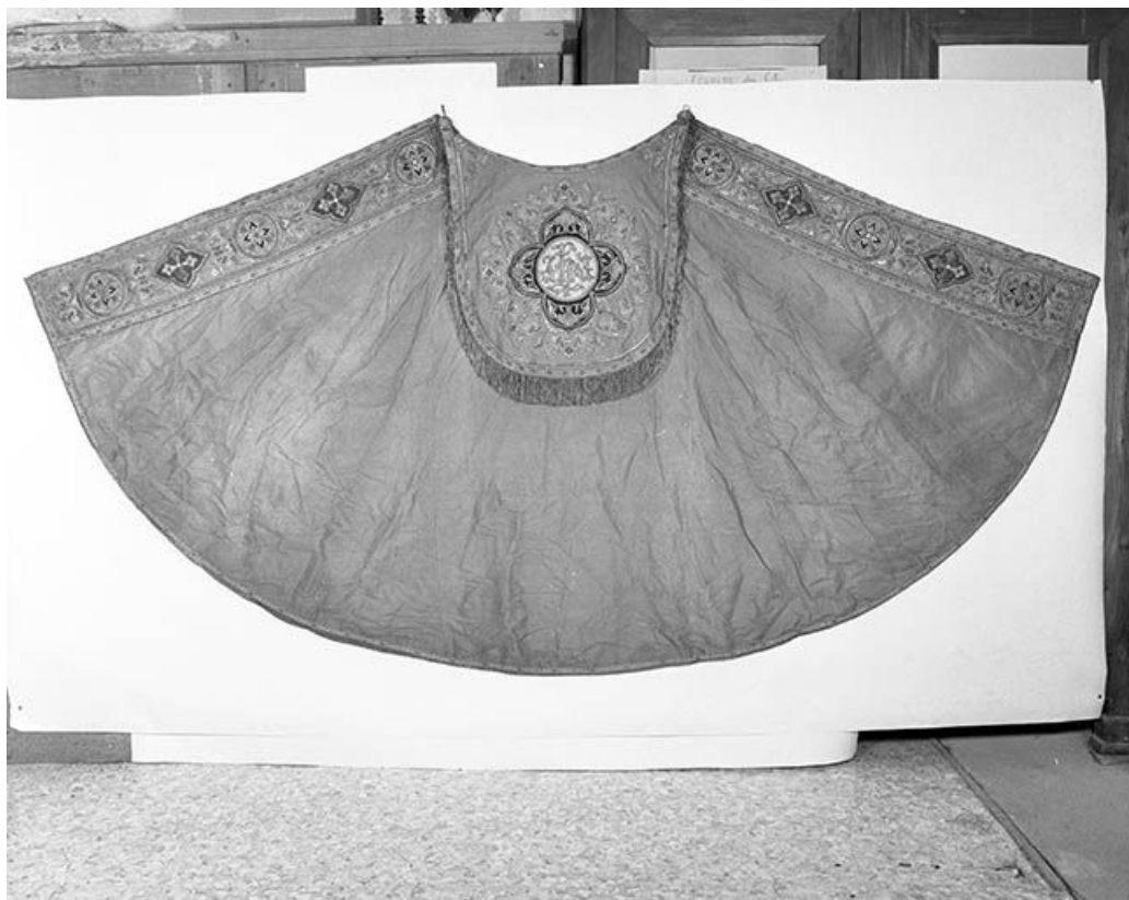
La chape. 39, Bornay