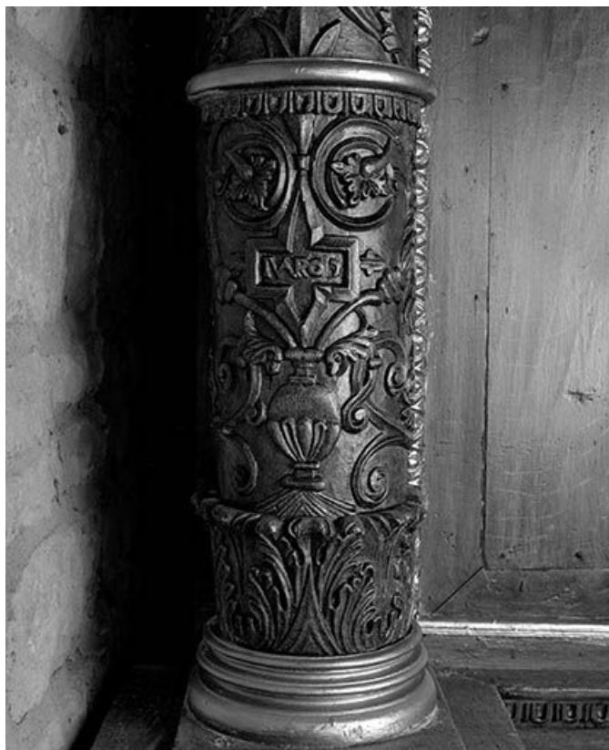
Détail : partie inférieure de la colonne de gauche du retable. 39, Bornay