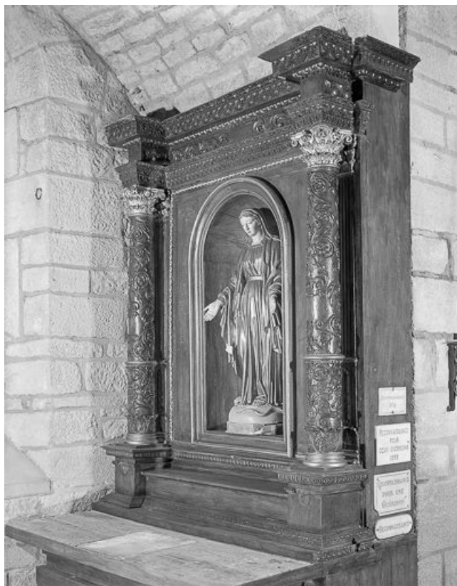
Vue générale du retable.