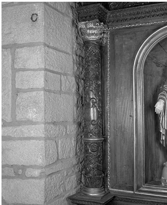
Détail : colonne gauche du retable.