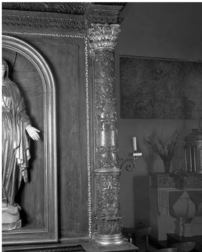
Détail : colonne de droite du retable.