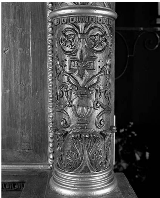
Détail : partie inférieure de la colonne de droite du retable. 39, Bornay