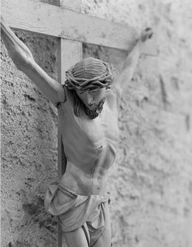
Détail : torse, trois quarts droit.

39, Toulouse-le-Château, lieudit : au Château