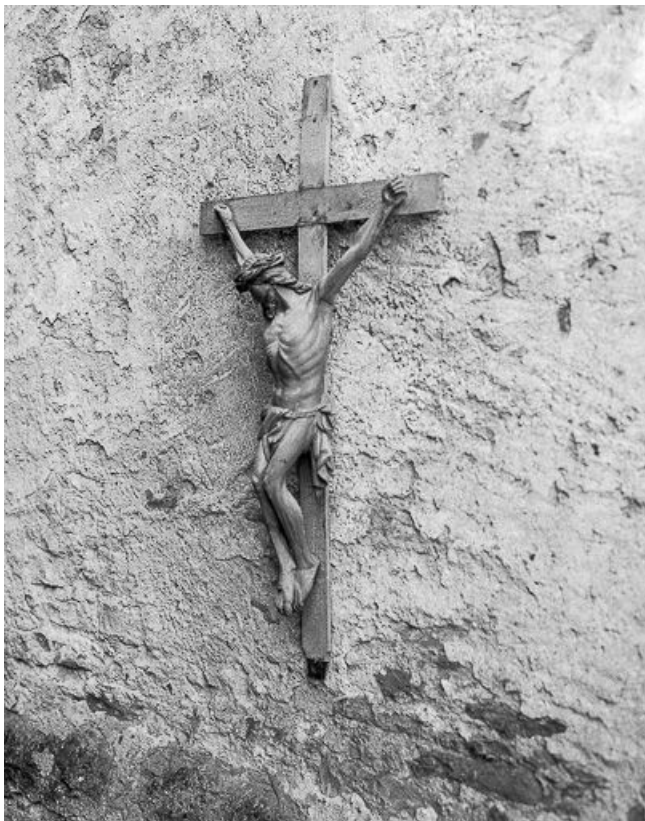
Vue de trois quarts gauche.

39, Toulouse-le-Château, lieudit : au Château