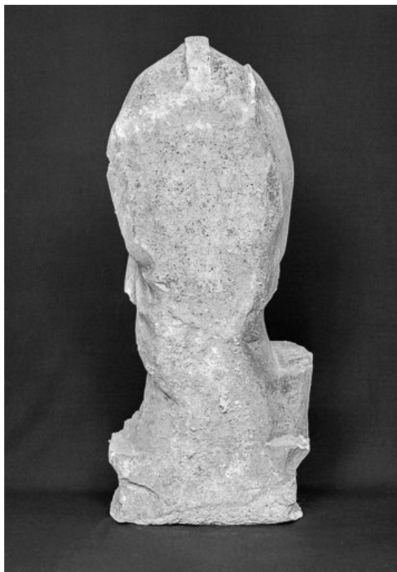
Vue du revers.