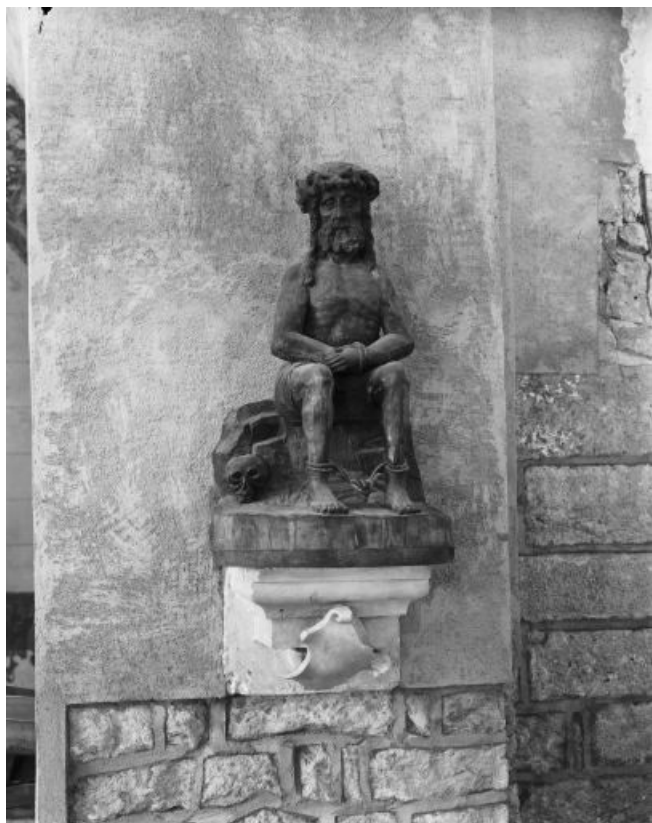
Vue de face.