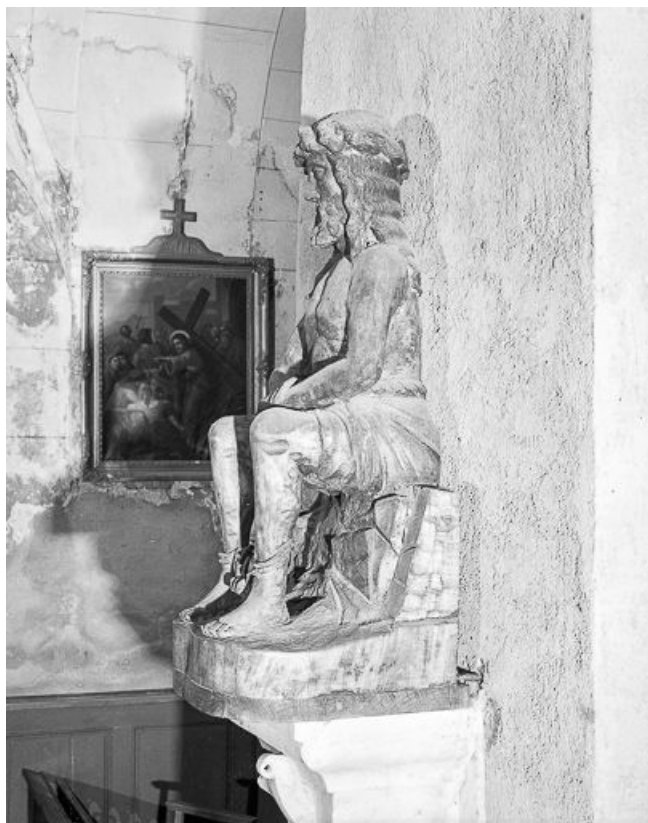
Vue de trois quarts gauche.