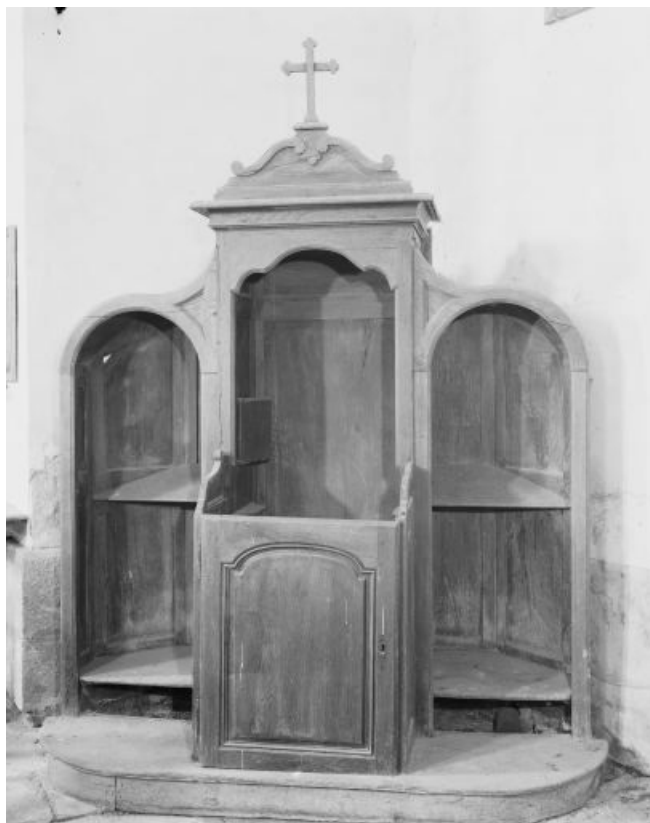
Vue d'un confessionnal.