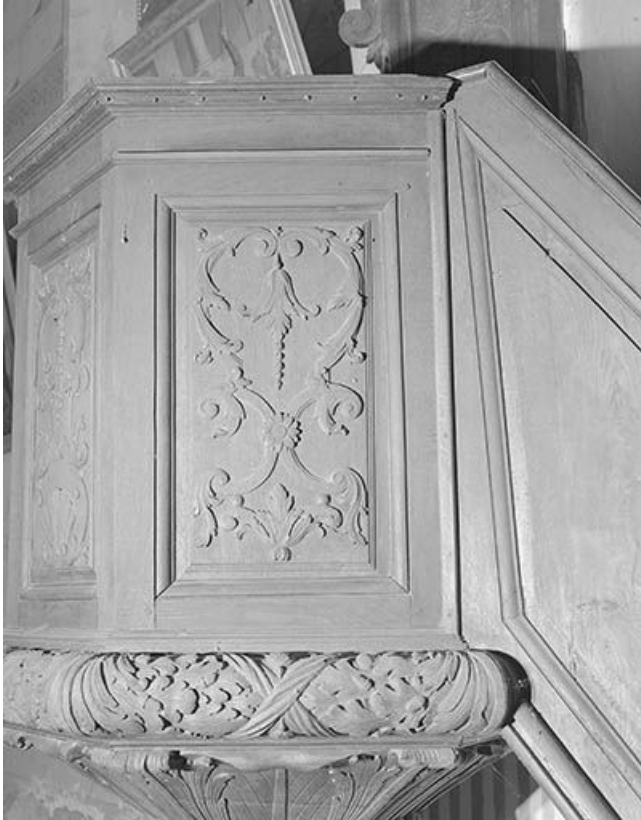
Cuve : quatrième panneau.