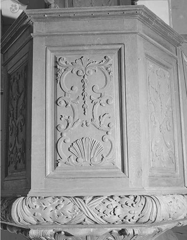
Cuve : troisième panneau.