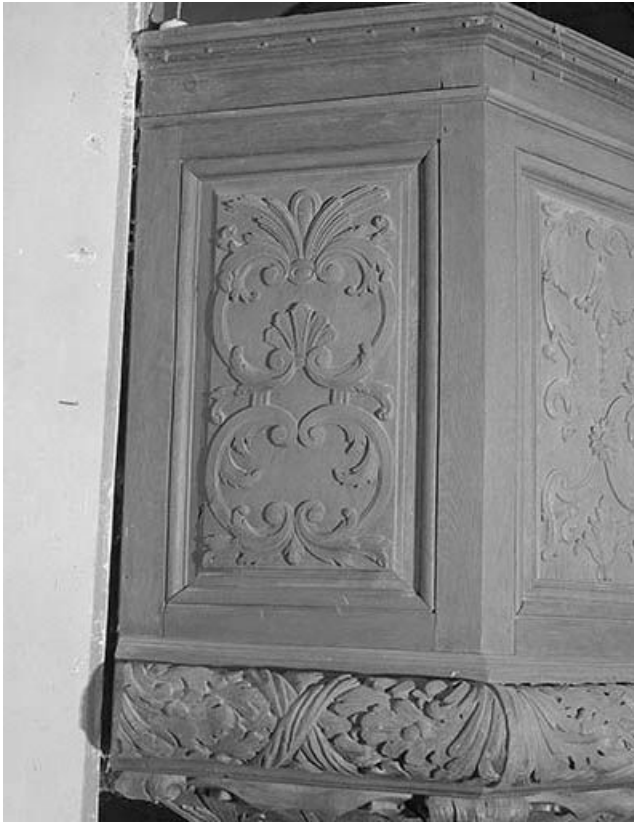
Cuve : premier panneau.