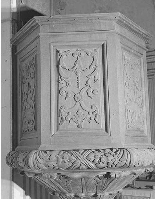
Cuve : deuxième panneau.