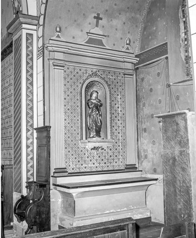
Vue rapprochée de l'autel latéral droit. 39, Bréry