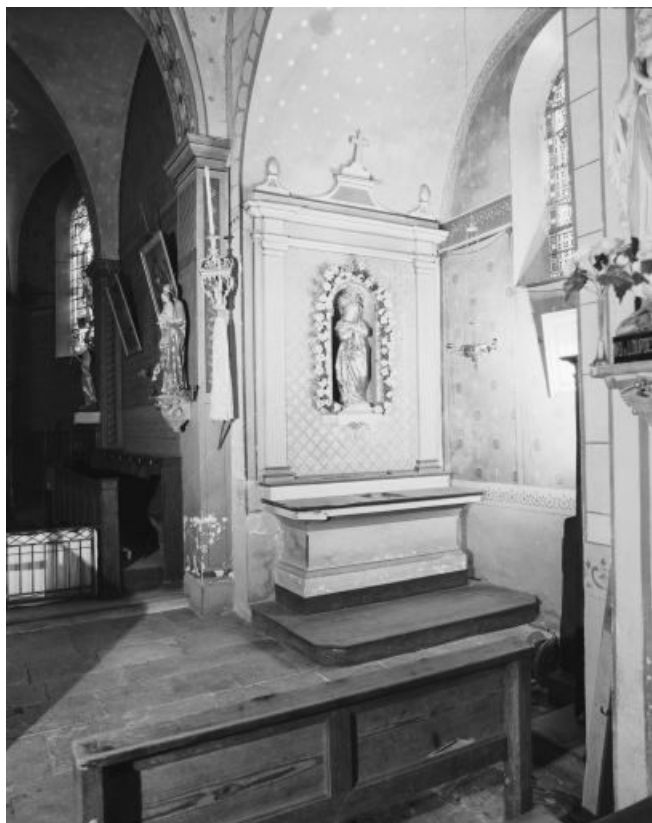
Vue de l'autel-retable latéral droit.