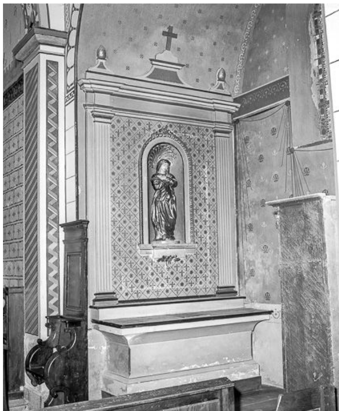
Vue rapprochée de l'autel latéral droit. 39, Bréry