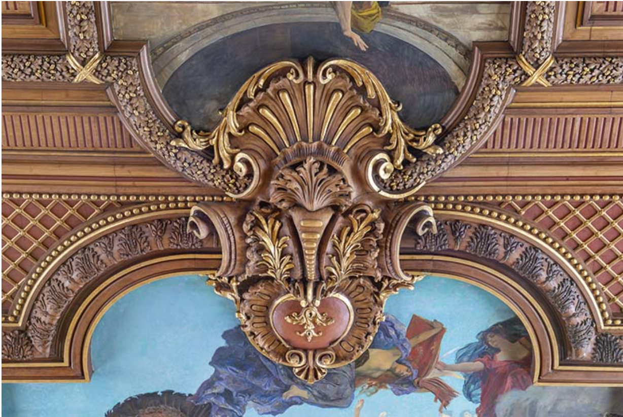
Détail du décor sculpté : cartouche, cuir découpé et palme.