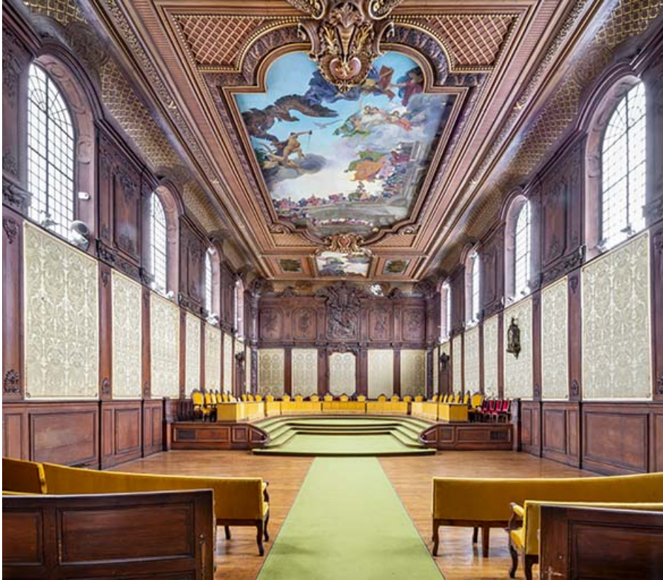
Vue de la salle des audiences solennelles en direction du sud-ouest.