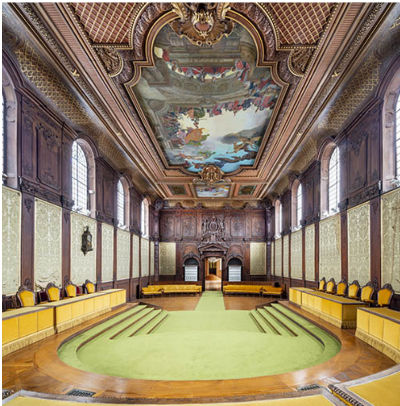
Vue de la salle des audiences solennelles en direction du nord-est, porte ouverte. 25, Besançon, 2 rue Hugues Sambin