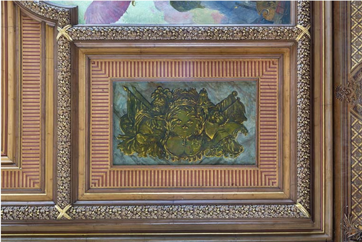
Détail du décor peint : trophée militaire aux armes de France.