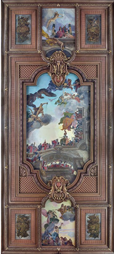
Vue d'ensemble du plafond.