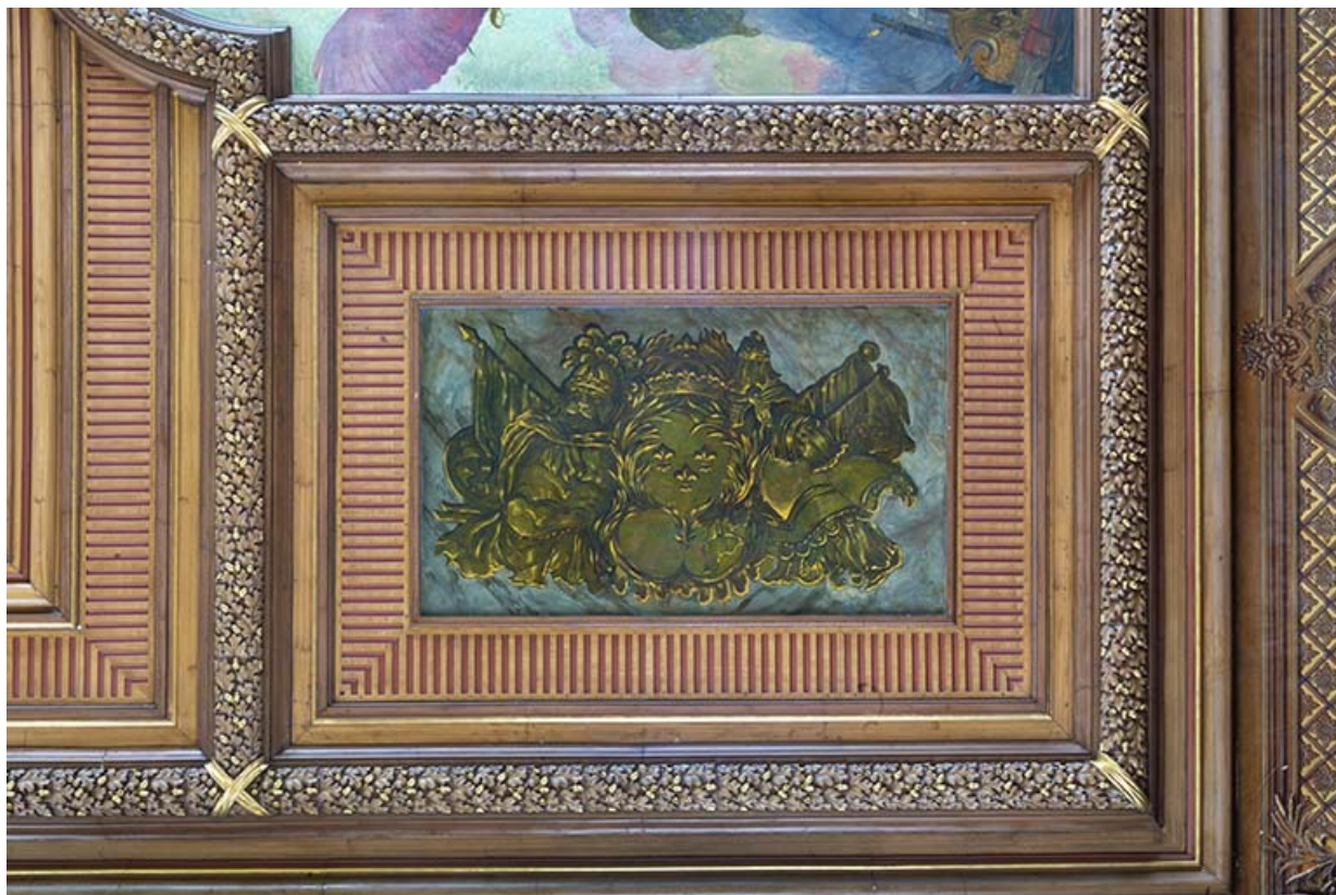
Détail du décor peint : trophée militaire aux armes de France.