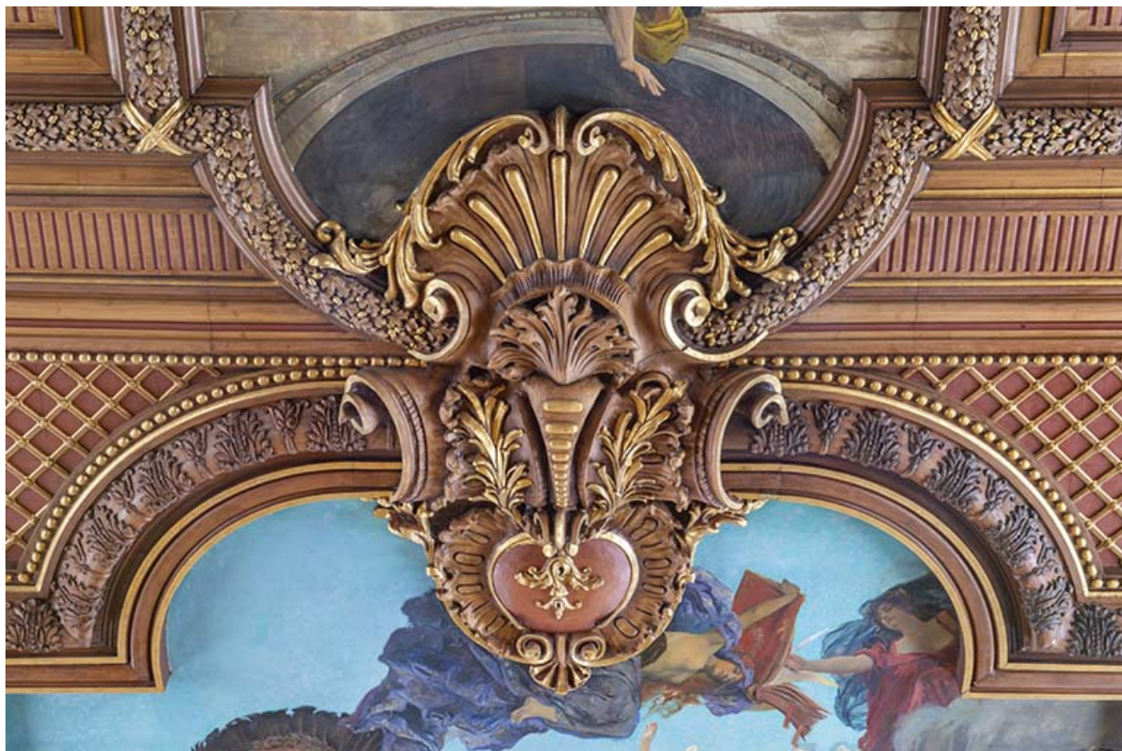
Détail du décor sculpté : cartouche, cuir découpé et palme.