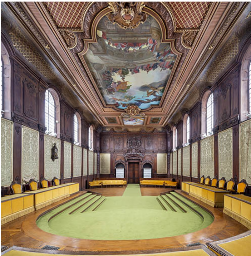
Vue de la salle des audiences solennelles en direction du nord-est, porte fermée. 25, Besançon, 2 rue Hugues Sambin