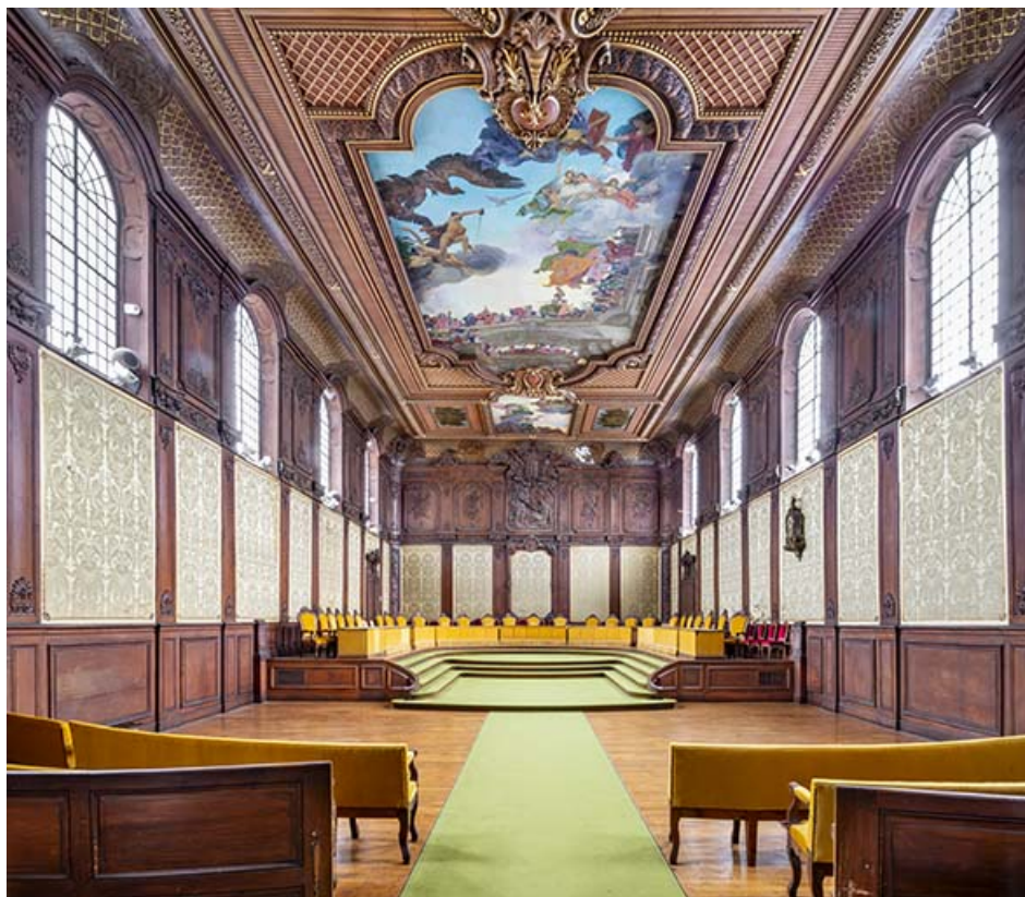
Vue de la salle des audiences solennelles en direction du sud-ouest.