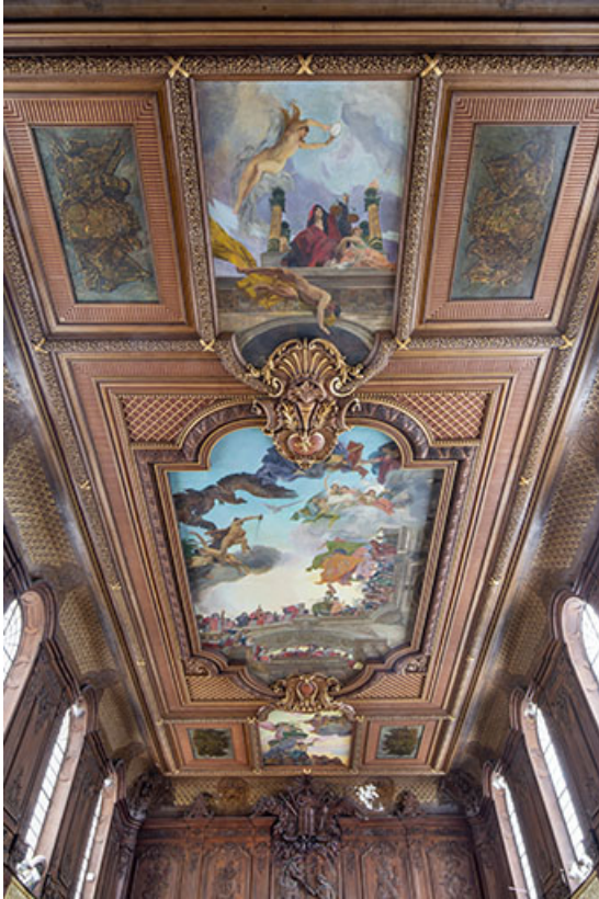
Vue d'ensemble du plafond.