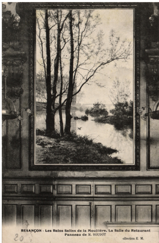
Vue ancienne du tableau encore en place dans la salle du restaurant.