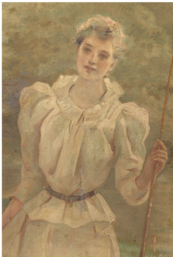
Détail, femme debout.