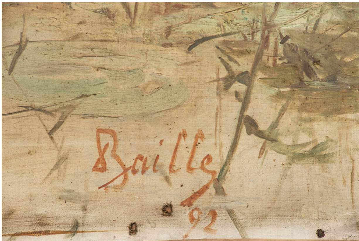
Détail, signature ("Baille 92").