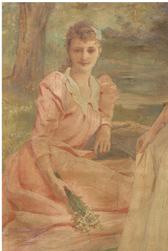
Détail, femme assise.