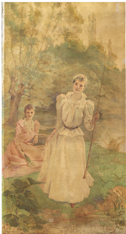
Tableau de Louis-Eugène Baille.