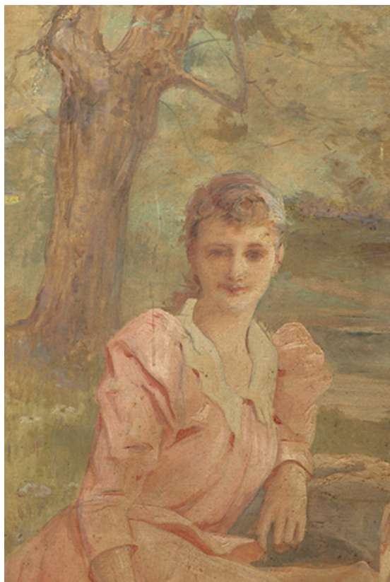
Détail, femme assise.