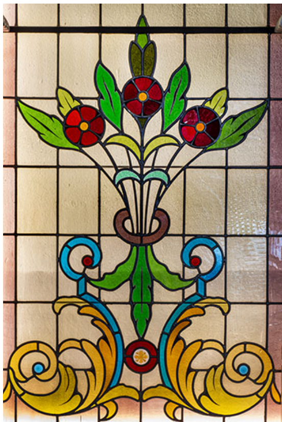
Détail de la verrière de gauche.

25, Besançon, 1 esplanade Jean-Luc Lagarce