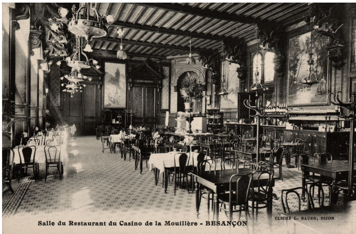
Salle du restaurant (vers 1900). 25, Besançon, 2 place du Théâtre