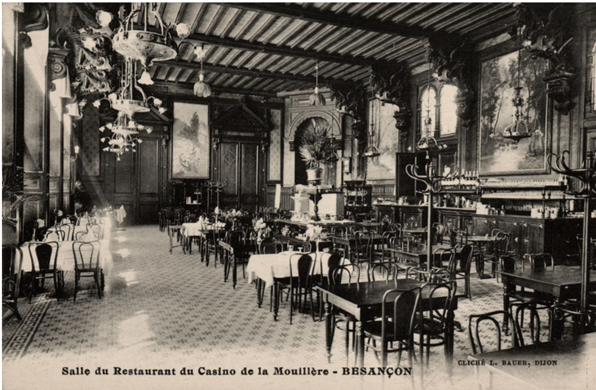
Salle du restaurant (vers 1900).