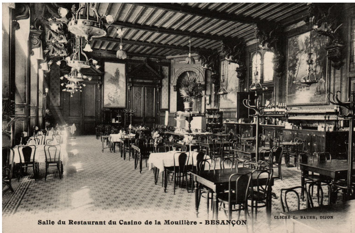
Salle du restaurant (vers 1900).