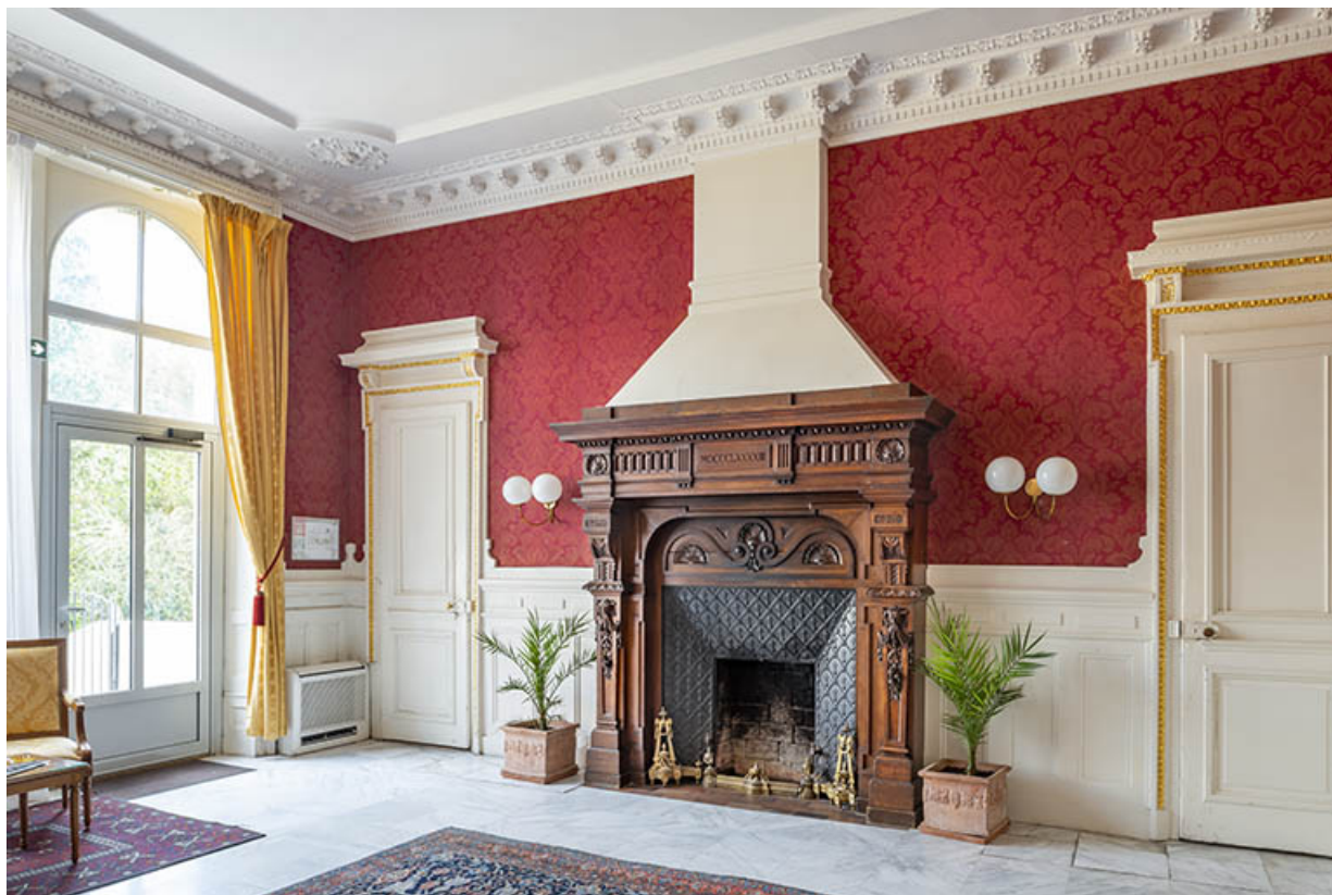
Mur sud de la salle à manger.