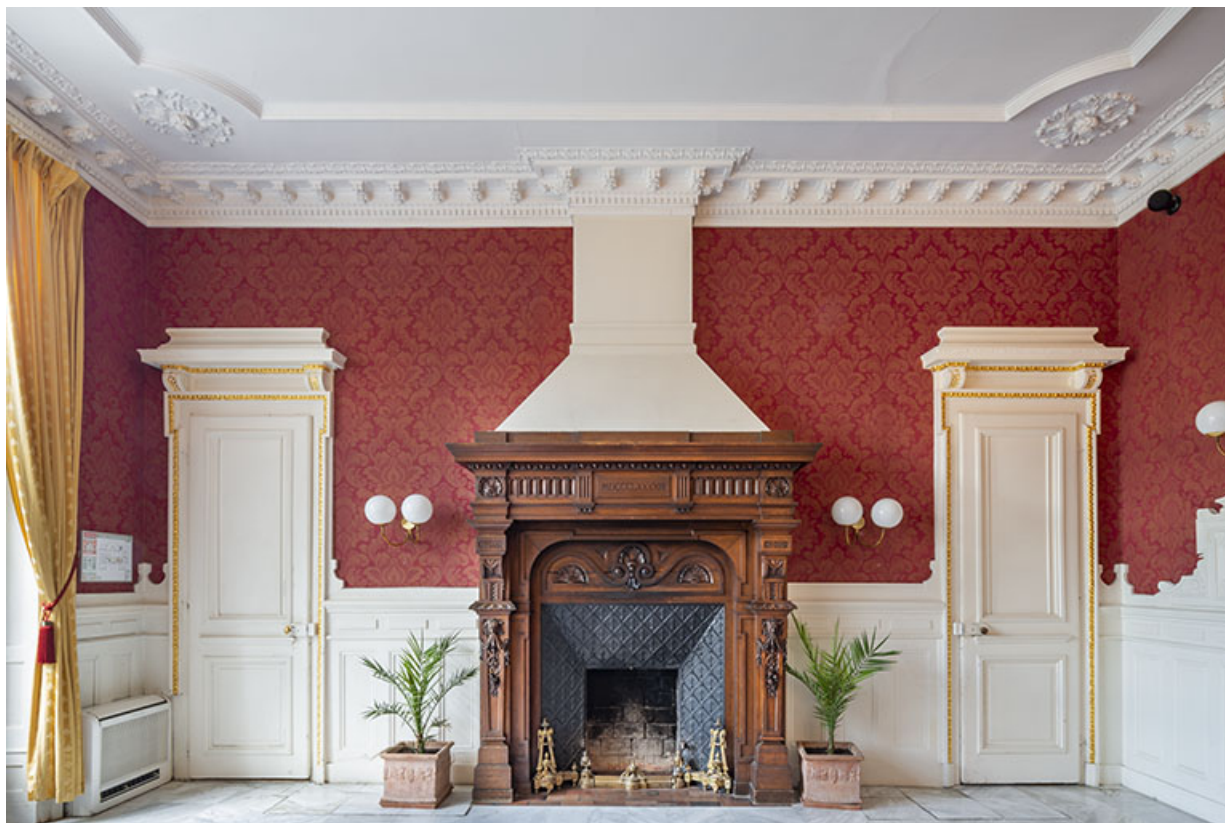
Mur sud de la salle à manger.