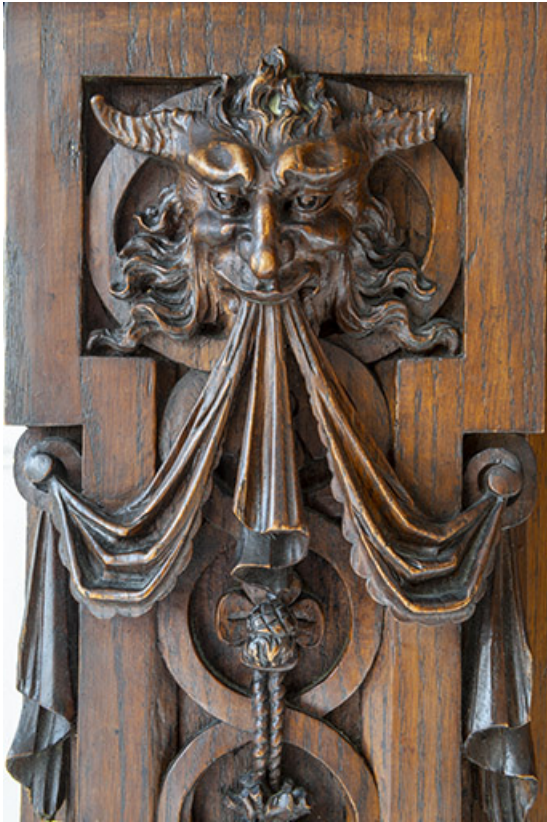
Détail des parties sculptées, tête de créature hybride, vue de face.