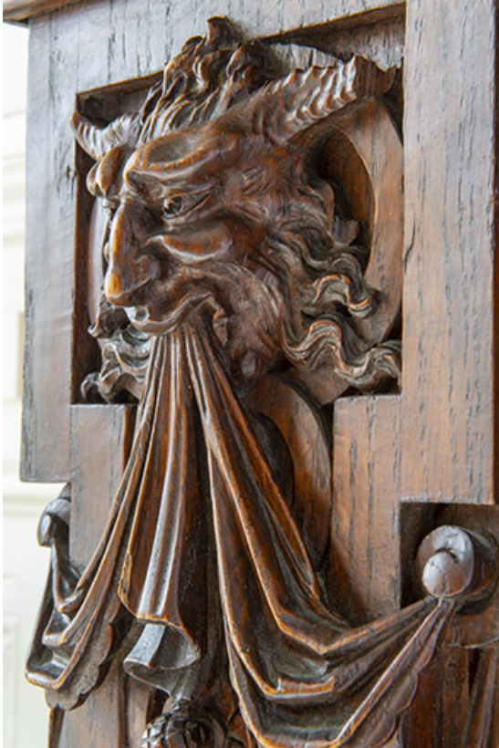
Détail des parties sculptées, tête de créature hybride, vue de trois quarts.