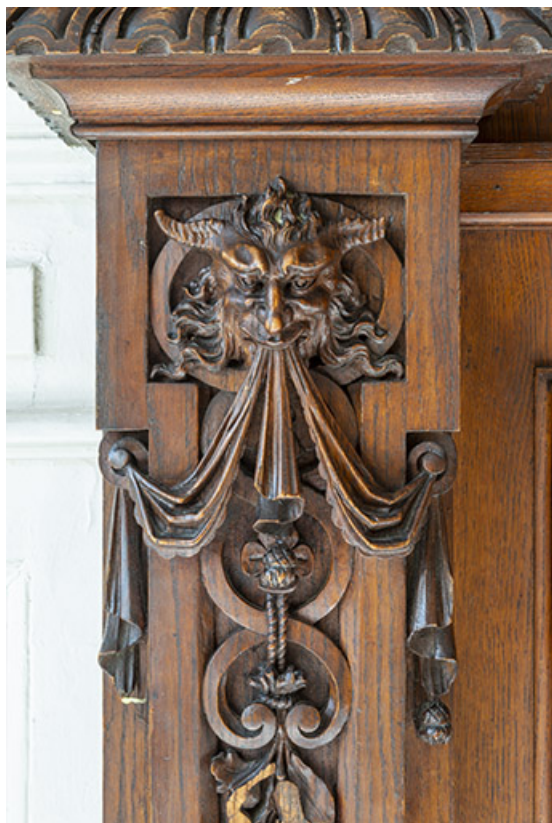
Montant latéral de gauche.