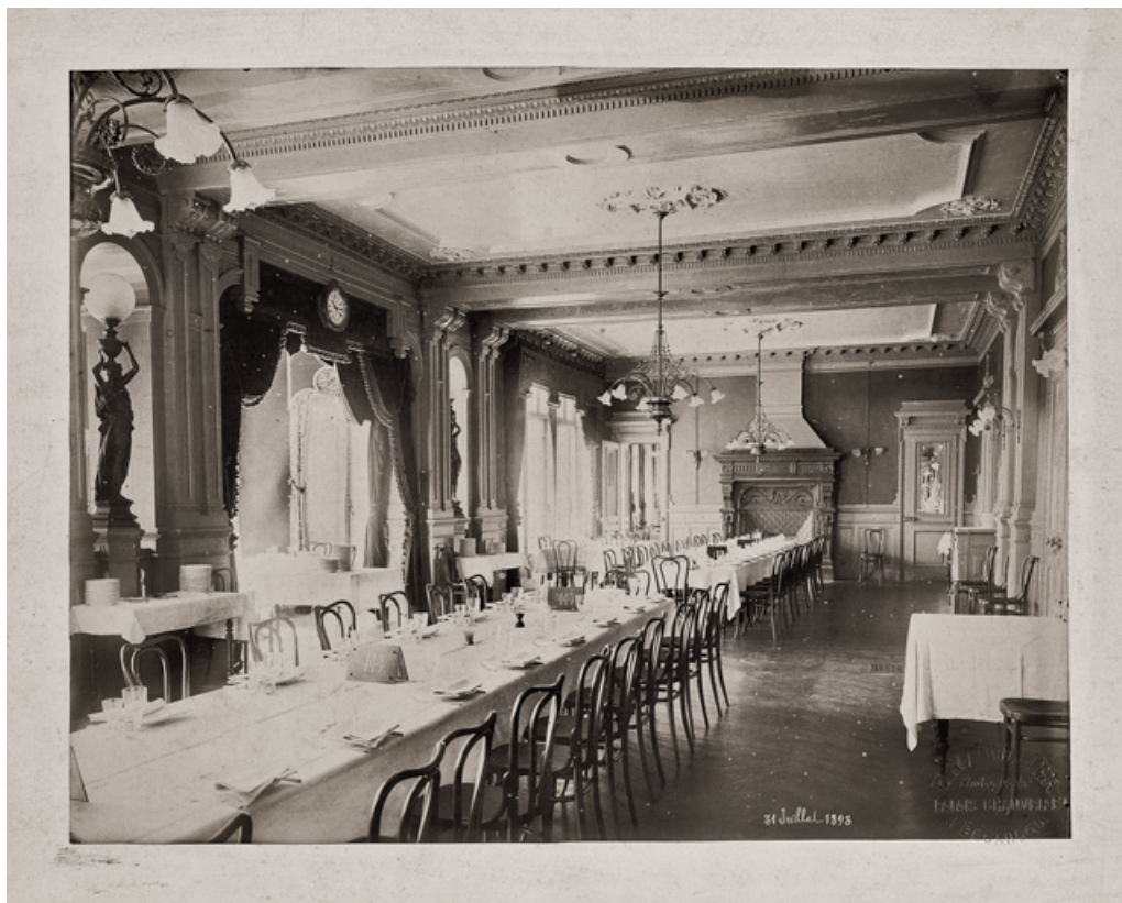
Salle à manger, vue en direction de la cheminée (31 juillet 1893).