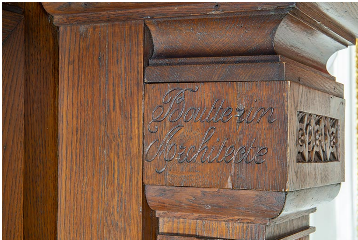
Inscription (signature) : "Boutterin architecte". 25, Besançon, 2 avenue Carnot