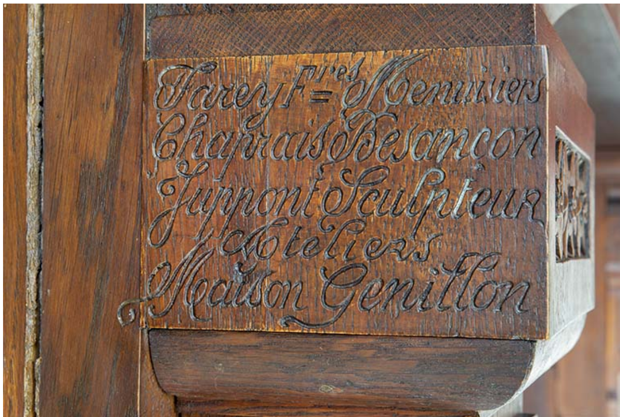
Inscription (signatures) : "Farey Frères menuisiers Chaprais Besançon Juppont sculpteur ateliers Maison Genillon". 25, Besançon, 2 avenue Carnot