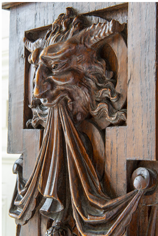
Détail des parties sculptées, tête de créature hybride, vue de trois quarts. 25, Besançon, 2 avenue Carnot