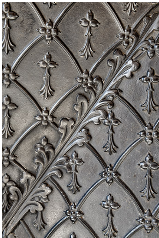
Contrecœur orné d'un semi d'hermine.