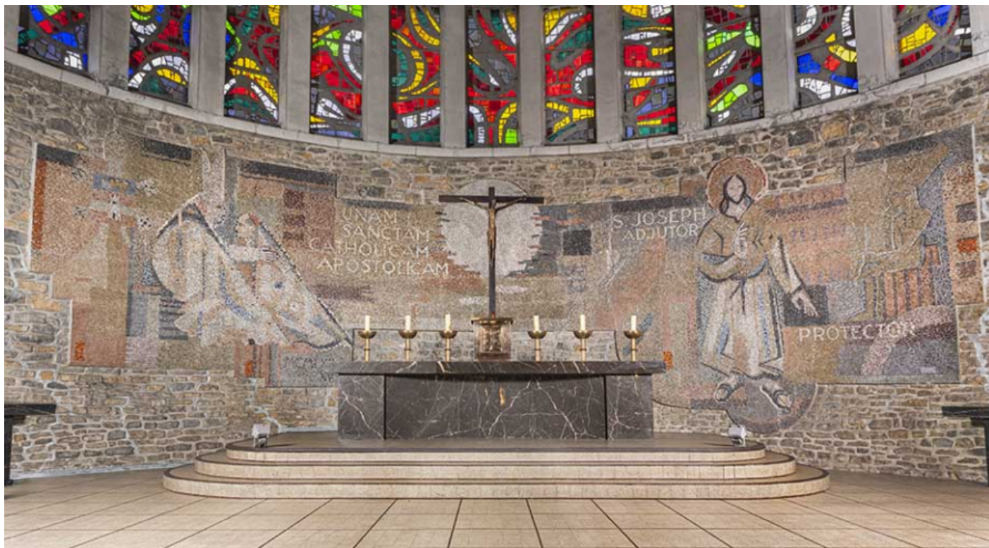
Ensemble de six chandeliers d'autel disposés de part et d'autre du tabernacle.