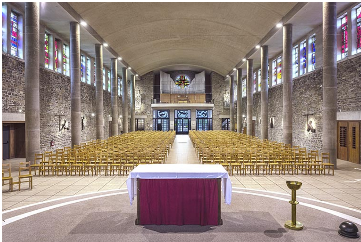
Chandelier de chœur, disposé à droite de l'autel.