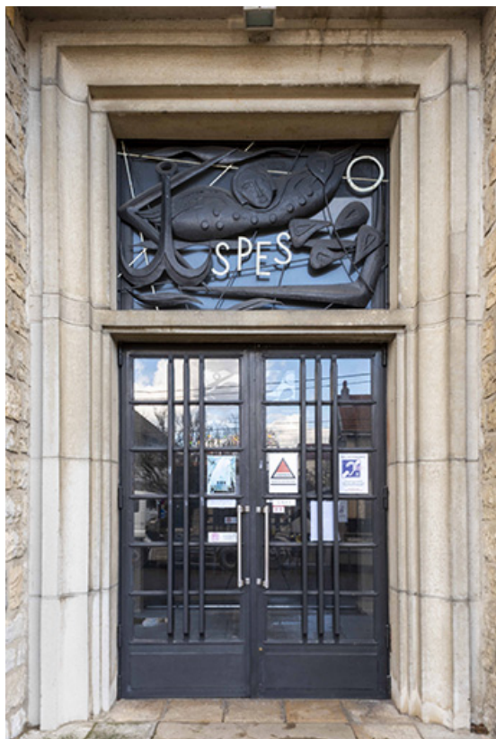
Vue de la porte centrale et de son châssis de tympan.