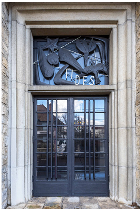
Vue de la porte et du châssis de tympan de gauche.