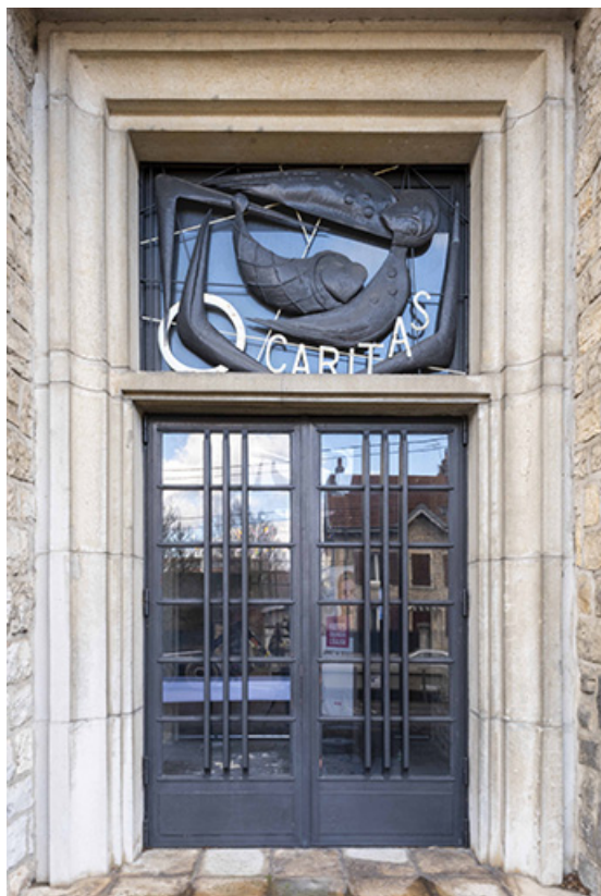
Vue de la porte et du châssis de tympan de droite.