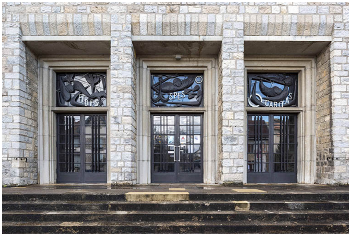
Vue d'ensemble des trois portes et châssis de tympan.