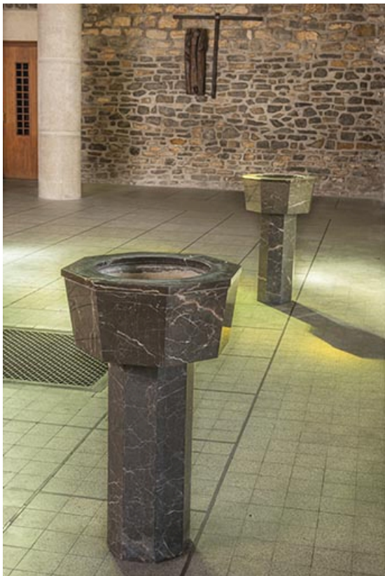
Vue des deux bénitiers.