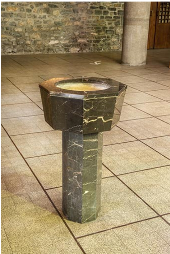
Vue d'un bénitier.