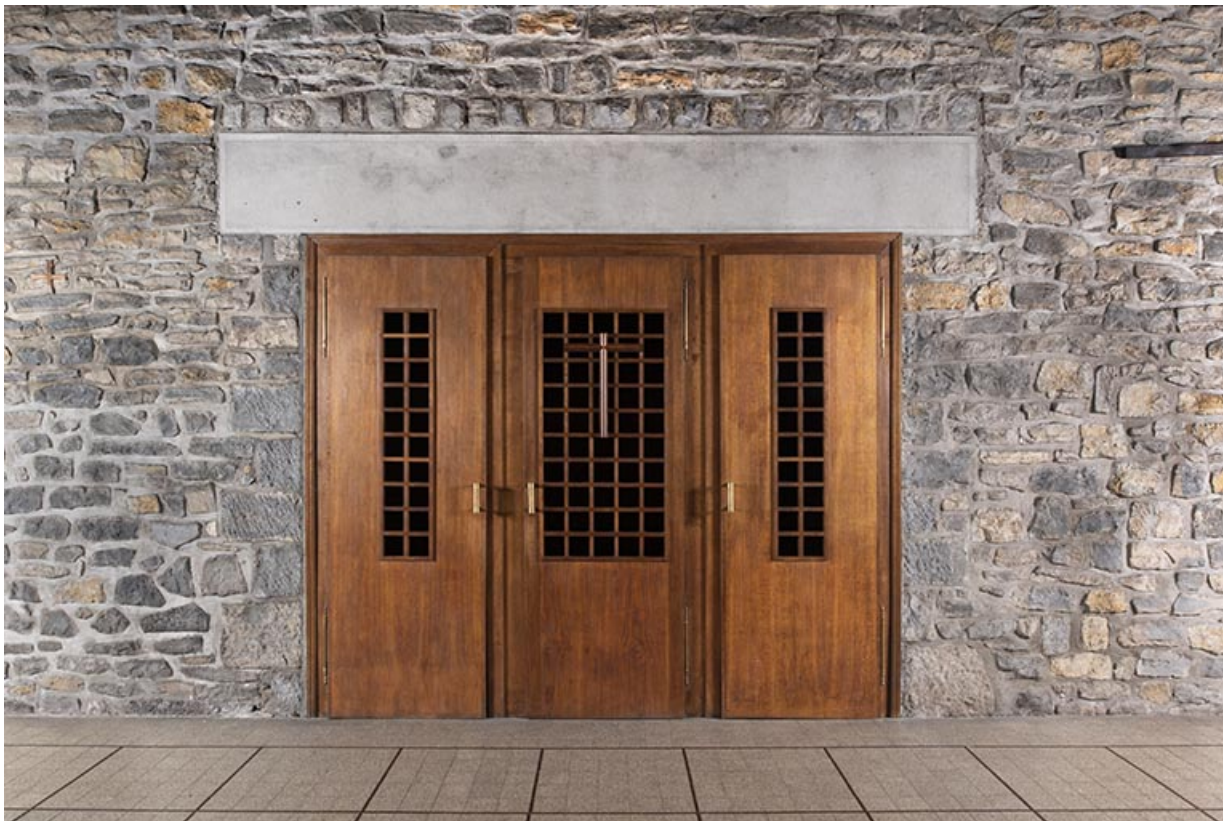
Vue d'un confessionnal.