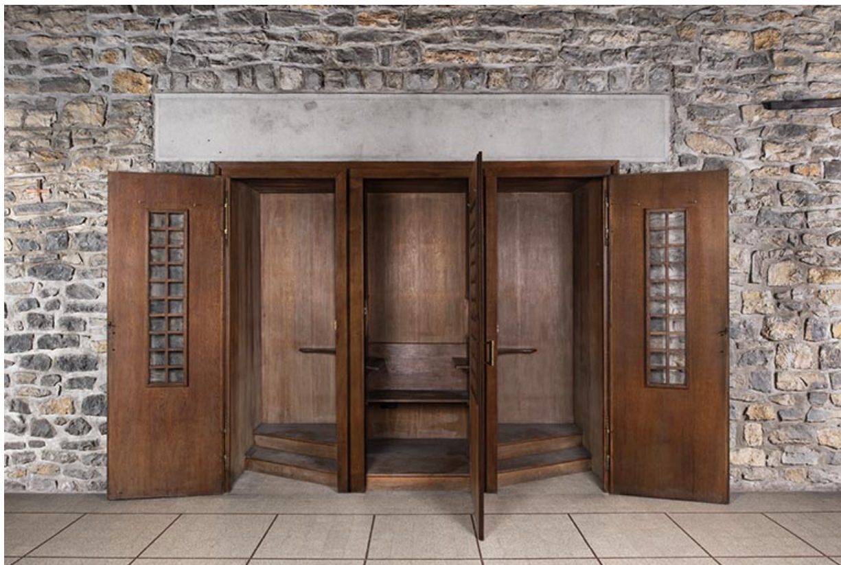
Vue d'un confessionnal, portes ouvertes.