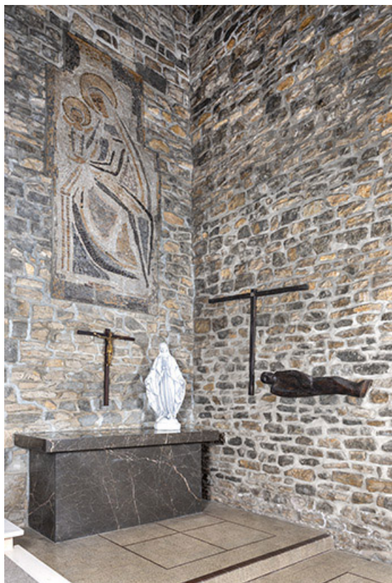
Quatorzième station : le corps de Jésus est mis au tombeau.