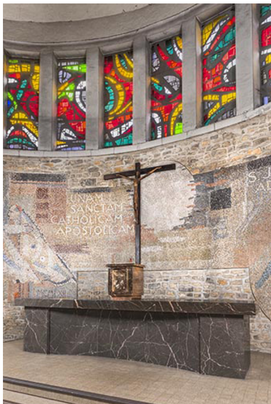
Vue du maître-autel, du tabernacle et de la croix d'autel.