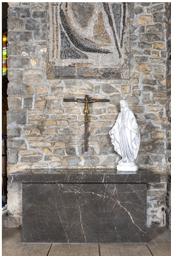
Vue d'ensemble de la croix d'autel.