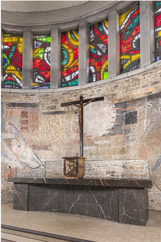
Vue du maître-autel, du tabernacle et de la croix d'autel.