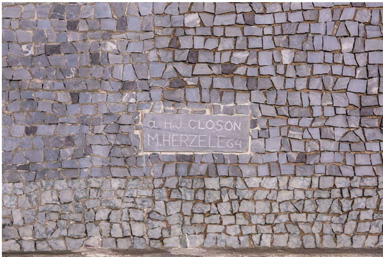
Revêtement mural du chœur en mosaïque. Détail de la signature.