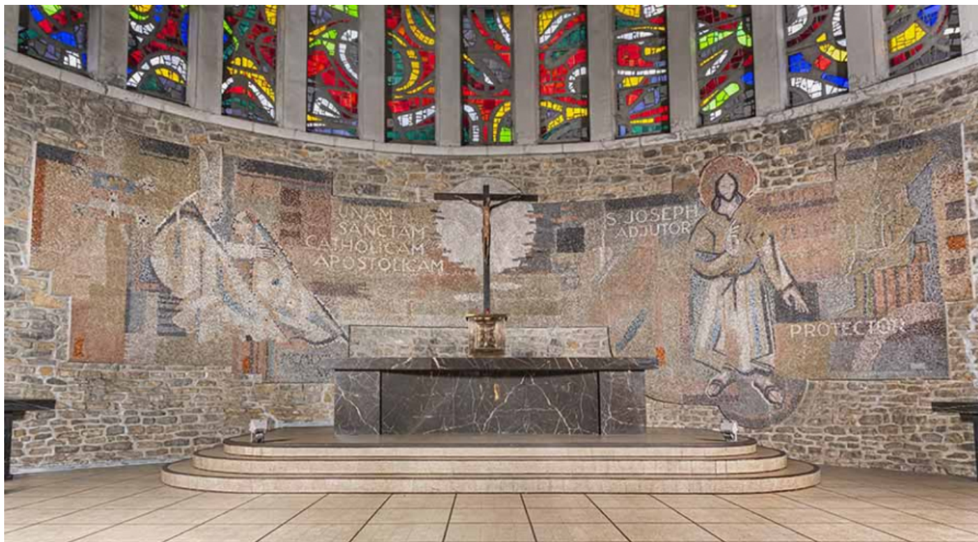
Revêtement mural en mosaïque du chœur. Vue d'ensemble.