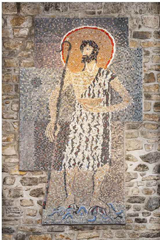
Revêtement mural en mosaïque de la chapelle des fonts représentant Saint-Jean-Baptiste. 25, Besançon, 18 avenue Villarceau