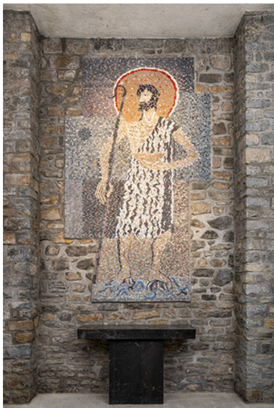
Revêtement mural en mosaïque et autel de la chapelle des fonts.