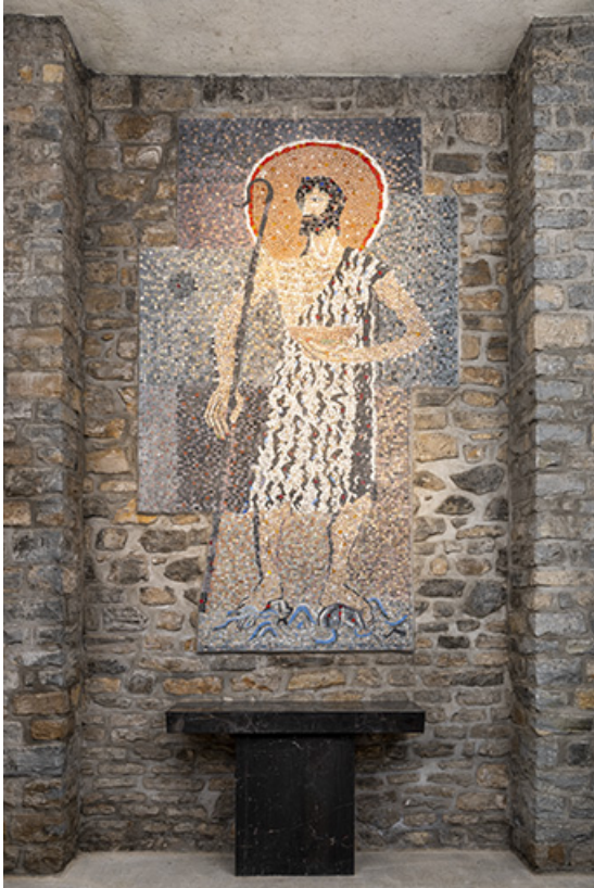
Revêtement mural en mosaïque et autel de la chapelle des fonts.