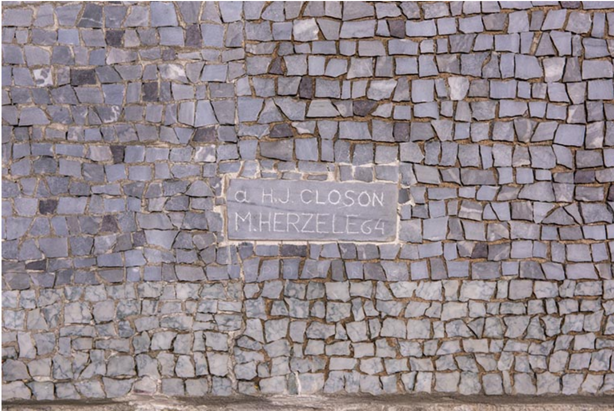
Revêtement mural du chœur en mosaïque. Détail de la signature.