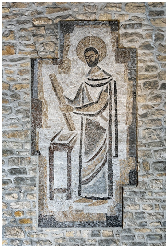
Revêtement mural en mosaïque représentant Saint-Joseph. 25, Besançon, 18 avenue Villarceau