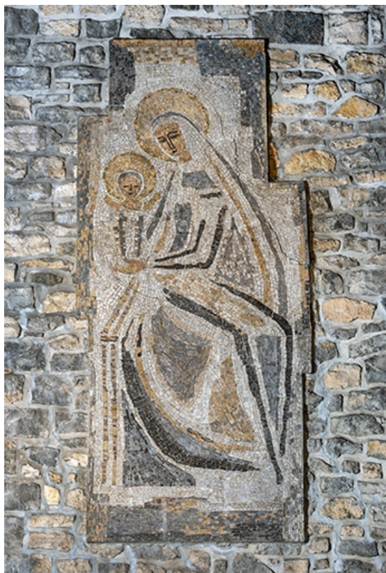
Revêtement mural en mosaïque représentant la Vierge et l'enfant Jésus.