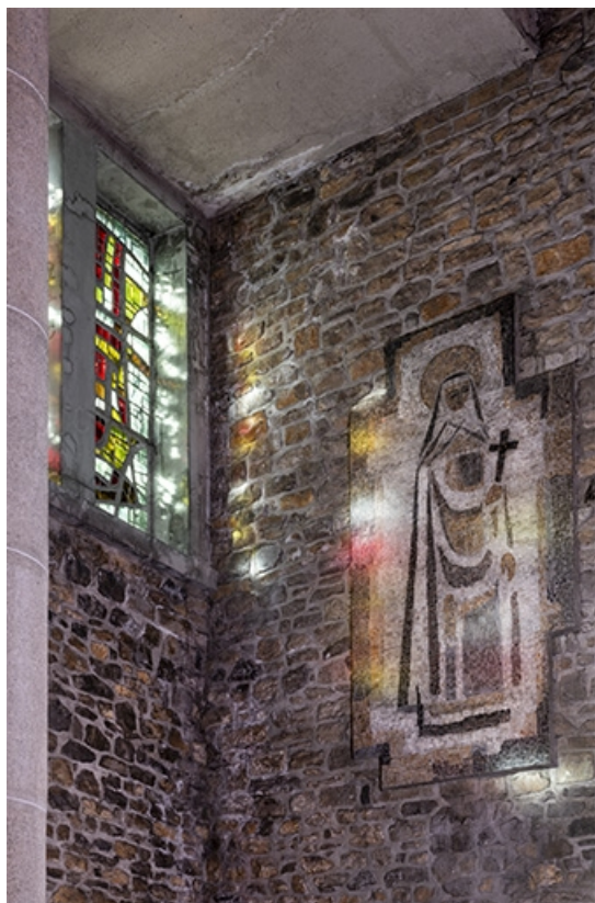
Revêtement mural en mosaïque représentant Sainte-Thérèse. Vue de trois-quarts. 25, Besançon, 18 avenue Villarceau