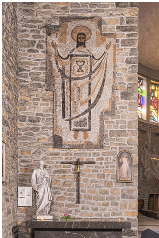
Revêtement mural en mosaïque représentant le Sacré-cœur.