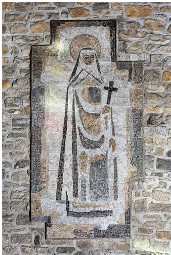
Revêtement mural en mosaïque représentant Sainte-Thérèse.