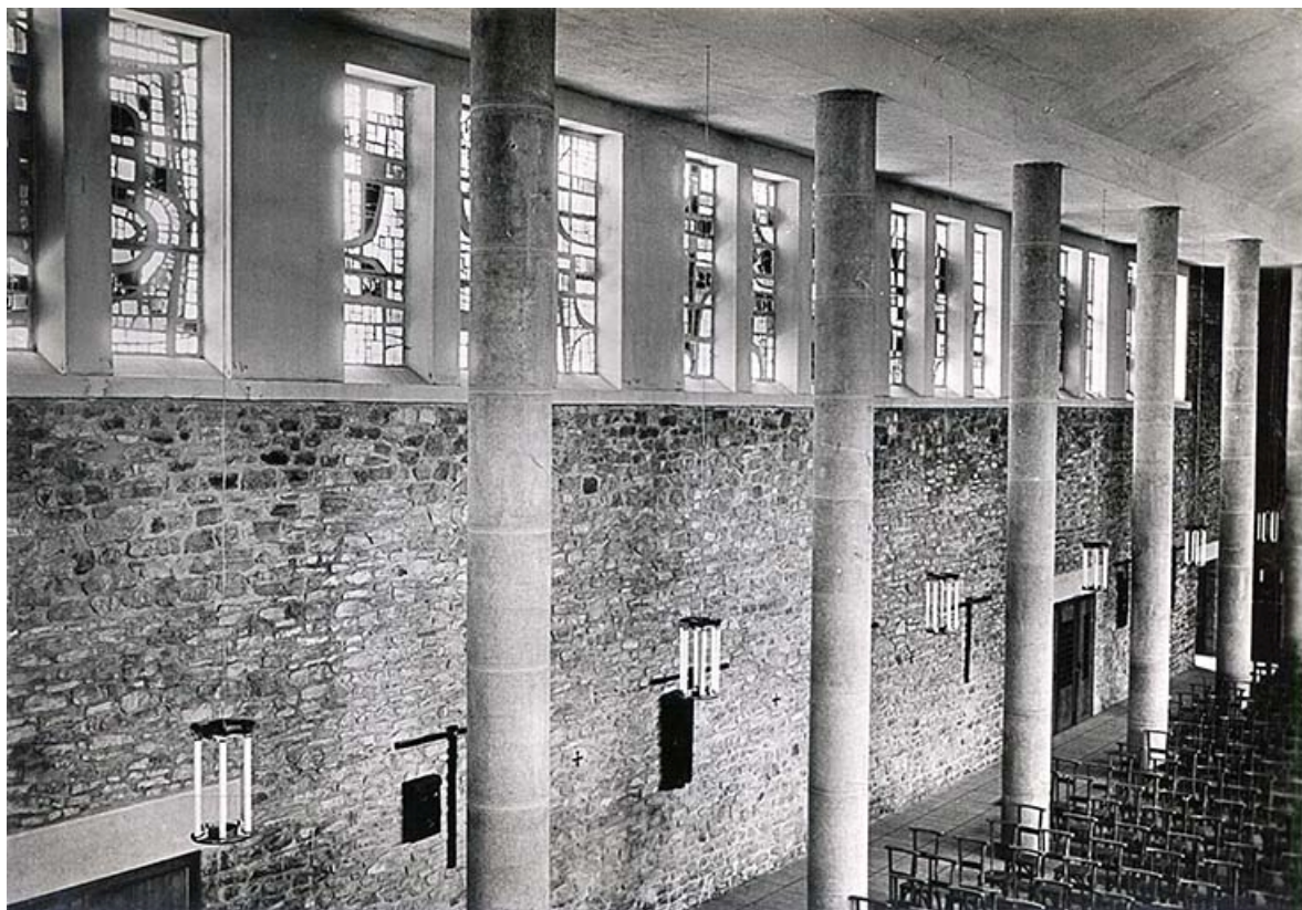
Nef de l'église Saint-Joseph de Besançon, verrières en dalle de verre et lustres dessinés par Jacques Le Chevallier. Carte postale ancienne. [s.d.]