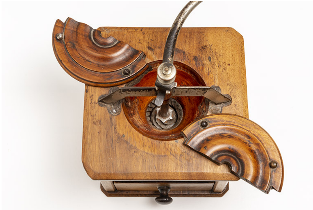
Moulin fabriqué à Valentigney. Vue plongeante.