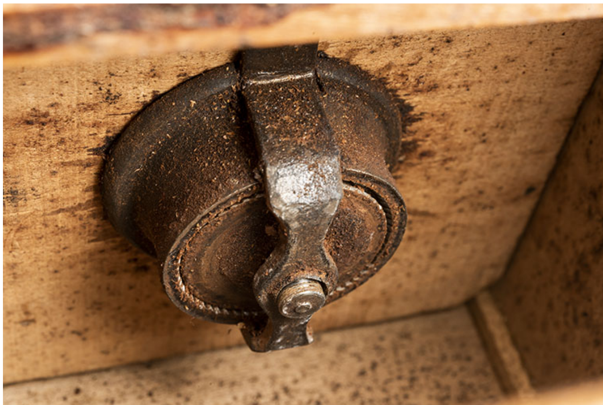
Moulin fabriqué à Valentigney. Mécanisme vu depuis le tiroir.