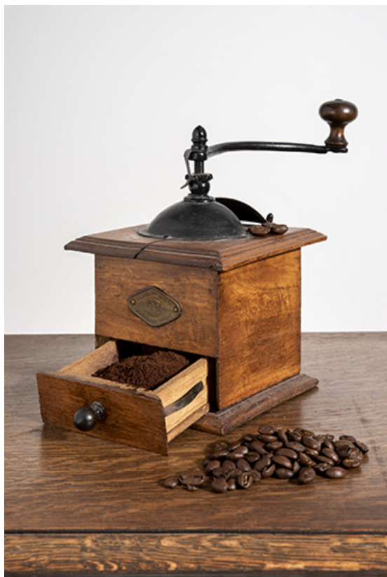
Moulin fabriqué à Pont-de-Roide. Vue générale, tiroir ouvert.