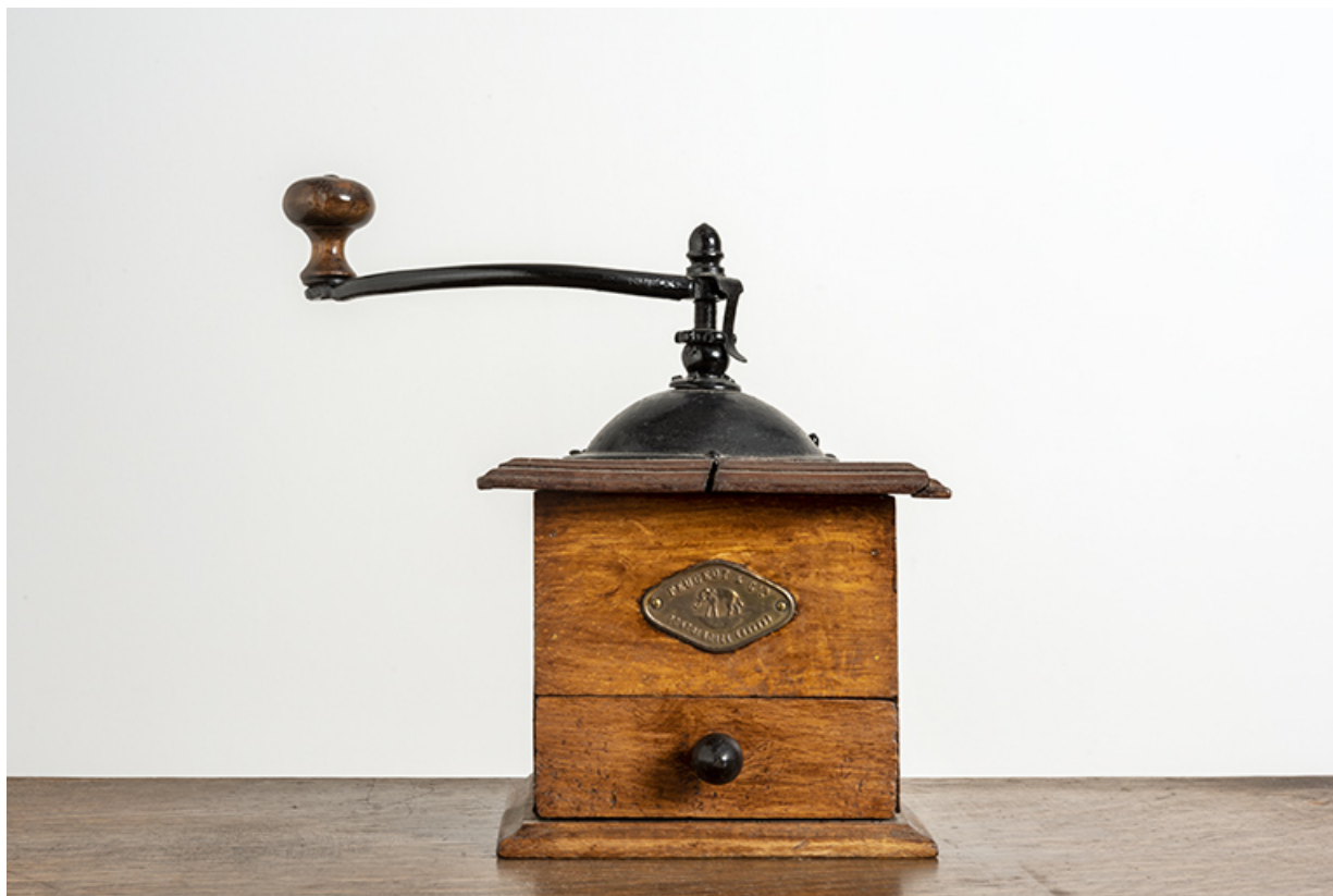
Moulin fabriqué à Pont-de-Roide.