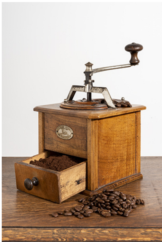
Moulin fabriqué à Valentigney. Vue générale, tiroir ouvert.