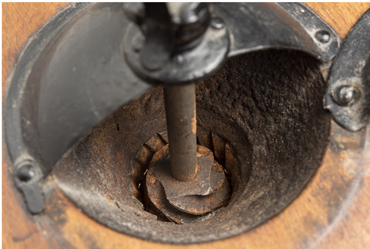
Moulin fabriqué à Pont-de-Roide. Mécanisme de broyage.