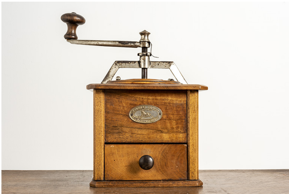
Moulin fabriqué à Valentigney.