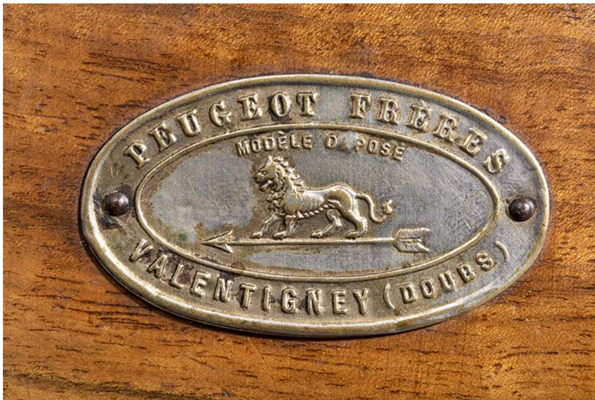
Moulin fabriqué à Valentigney. Plaque du fabricant.