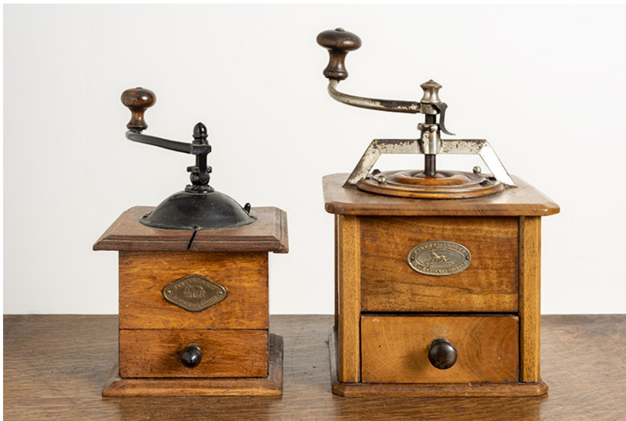
Ensemble de deux moulins de cuisine.