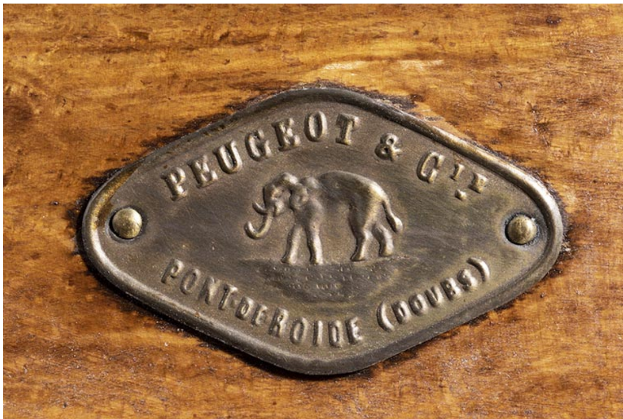
Moulin fabriqué à Pont-de-Roide. Plaque du fabricant.