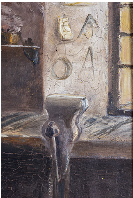
L'établi et l'étau à pied.

25, Montécheroux, 12 rue de la Pommeraie