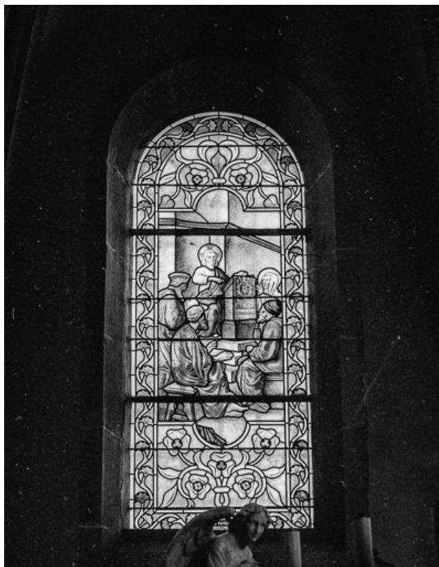
Baie 1 : vue d'ensemble.

25, Villers-le-Lac, lieudit : le Pissoux