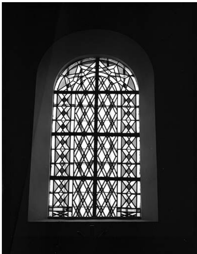
Baie n° 3. 25, Saules