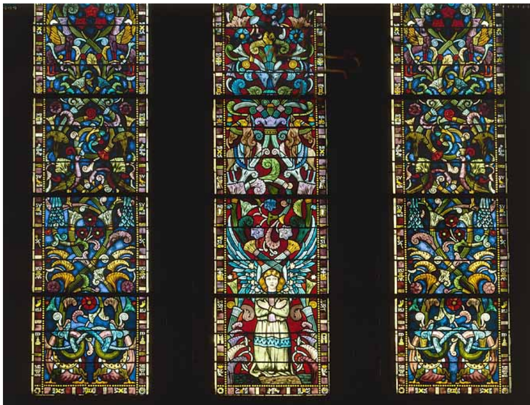
Baie 8, partie basse : Sacré Coeur de Jésus. 25, Pontarlier