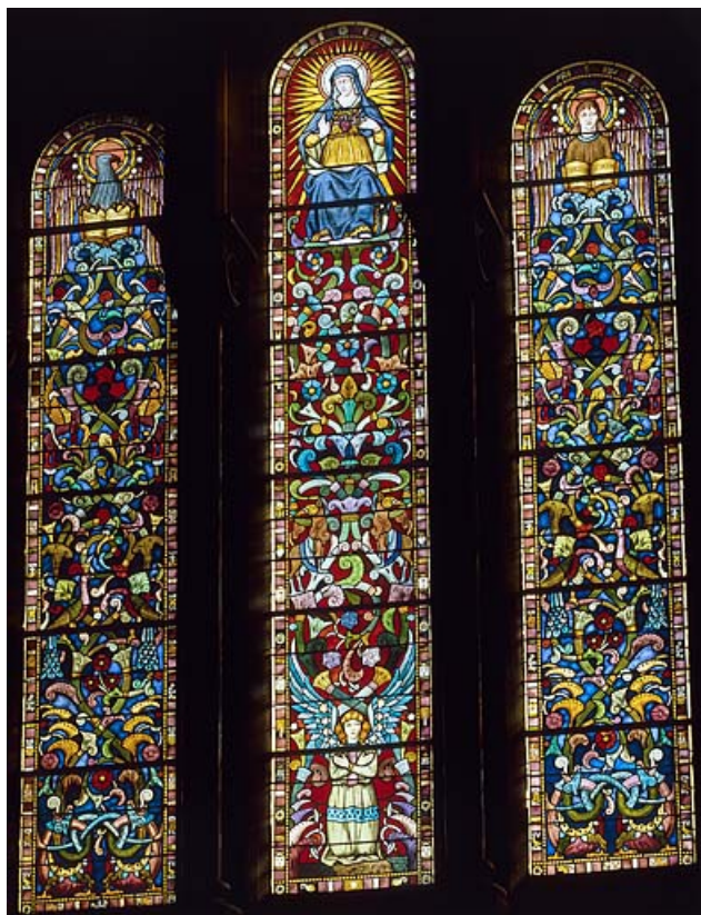
Baie 7 : Notre-Dame des Sept Douleurs. 25, Pontarlier