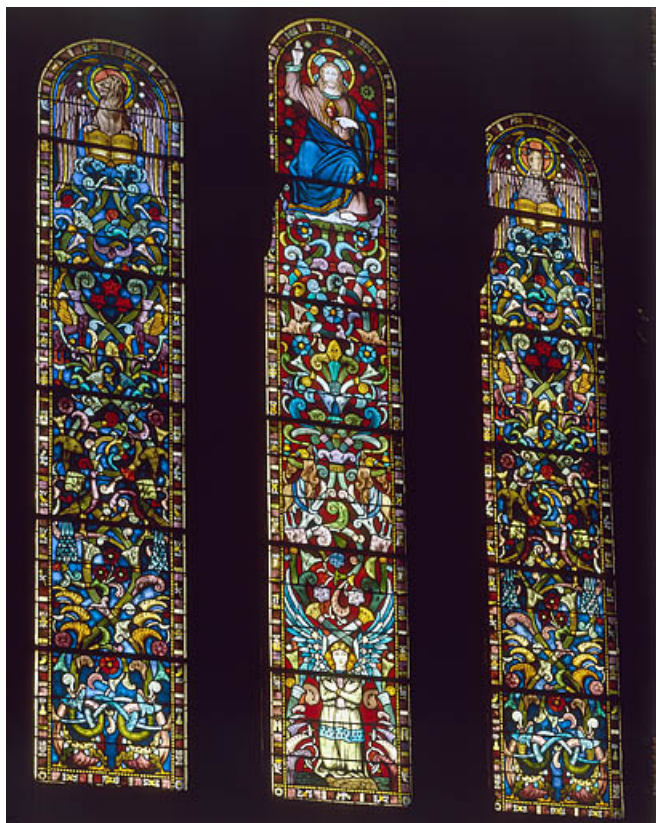
Baie 8 : Sacré Coeur de Jésus.