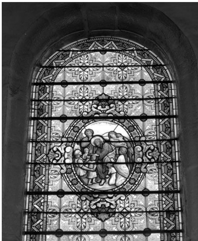
Baie 3 : vue d'ensemble. 25, Rang