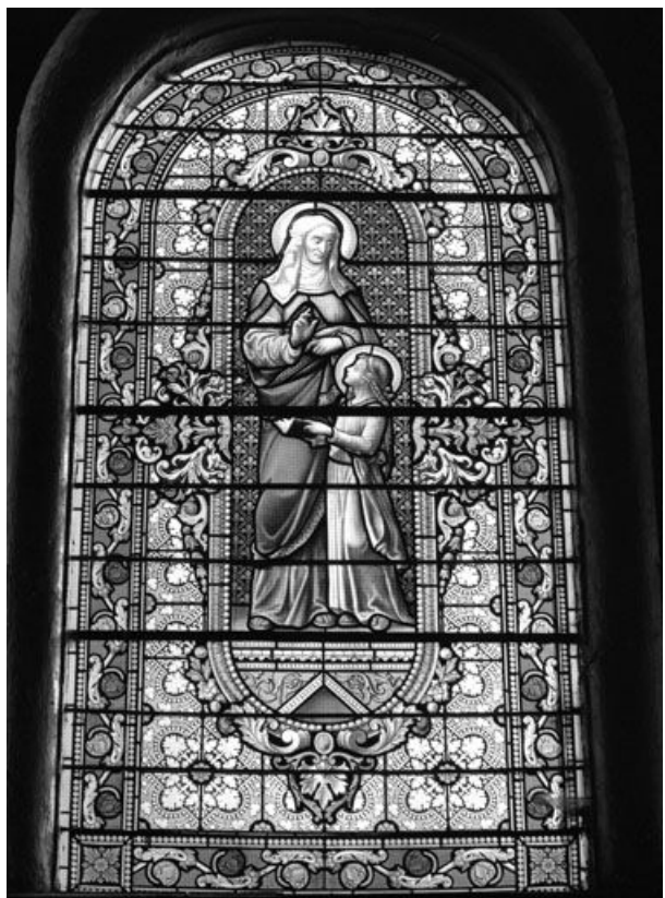
Baie 2 : vue d'ensemble.