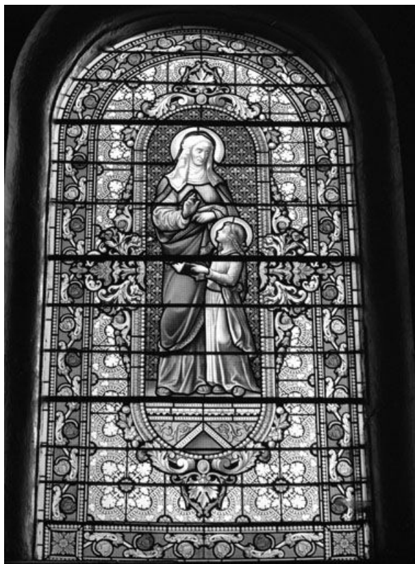
Baie 2 : vue d'ensemble.