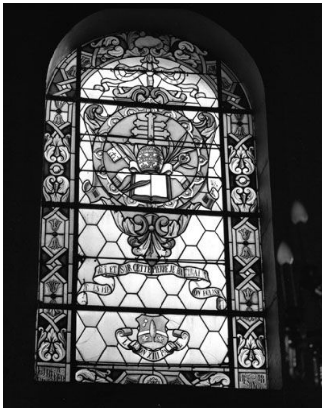
Baie 10 : vue d'ensemble.