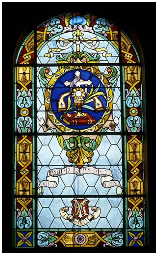
Baie 9 : vue d'ensemble.