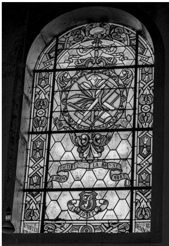
Baie 5 : vue d'ensemble.