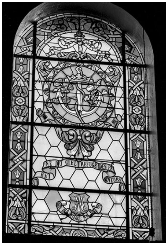
Baie 6 : vue d'ensemble.