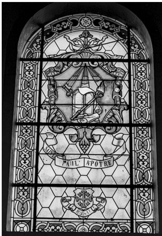
Baie 7 : vue d'ensemble.