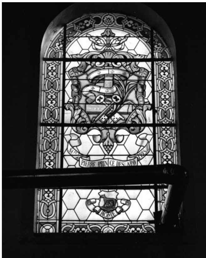
Baie 8 : vue d'ensemble.