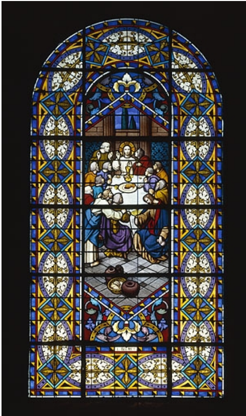
Baie 7 : la Cène, réalisée par L. Balmet au début du 20e siècle. 25, Mouthe