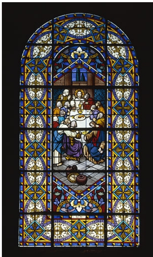
Baie 7 : la Cène, réalisée par L. Balmet au début du 20e siècle. 25, Mouthe