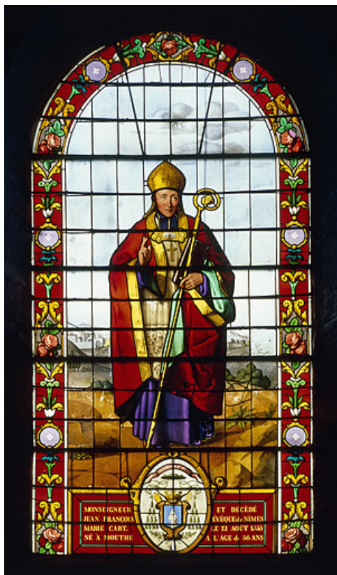
Baie 6, fin 19e siècle : François-Marie Carl, né à Mouthe, devenu évêque de Nîmes, mort en 1855. 25, Mouthe