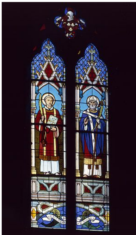
Baie 1 : vue d'ensemble. 25, Montrond-le-Château