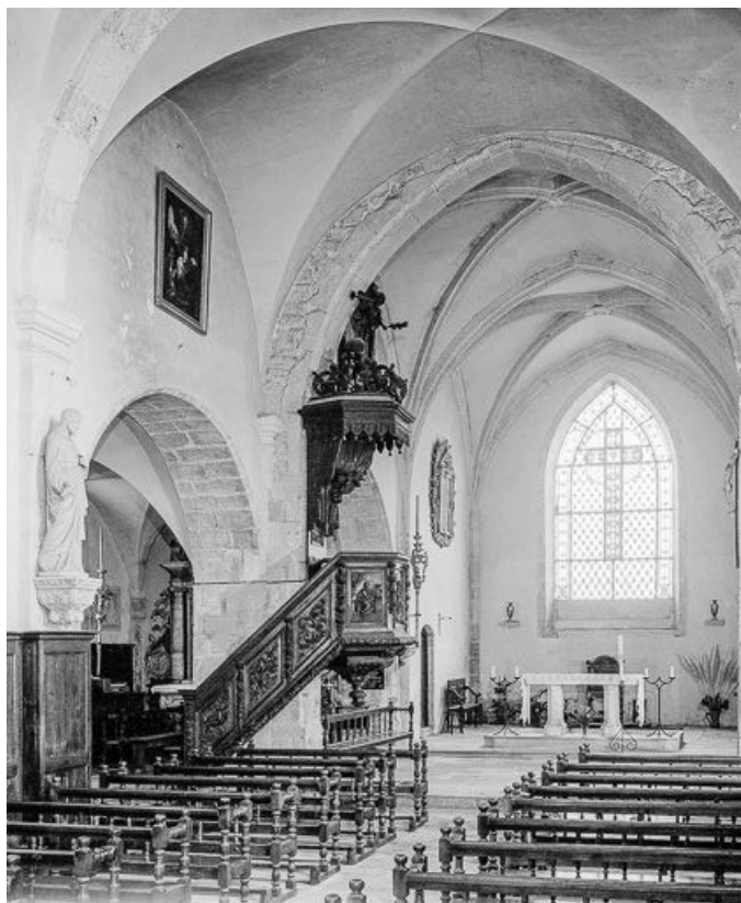
Intérieur : la nef et le chœur vus de trois quarts gauche. 25, Montgesoye