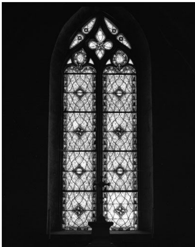
Baies 4 et 5 créées en 1903 par Félix Gaudin (grisailles dans le style du 14 e siècle avec petits médaillons en fermaillets) : baie 4. 25, Montbenoît