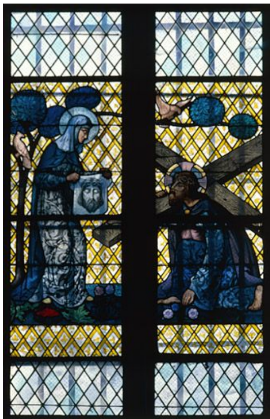
Baie 3 créée par Gruber (19e ou 20e siècle) : rencontre du Christ et de sainte Véronique sur le chemin du calvaire ; instruments de la Passion dans le tympan en grisaille et jaune d'argent dans le style Renaissance.