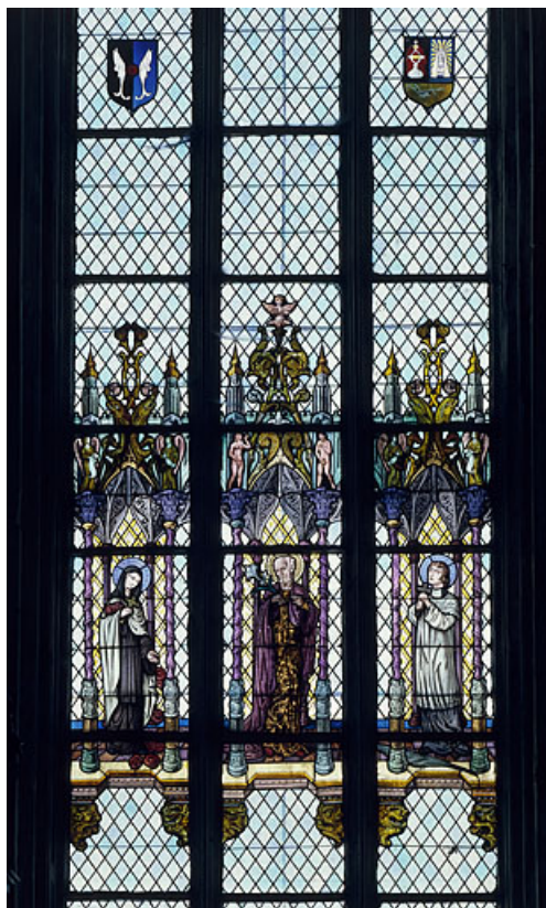
Baie 2 : sainte Thérèse, saint Joseph et saint François-Xavier. 25, Montbenoît