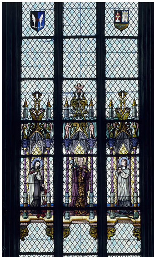
Baie 2 : sainte Thérèse, saint Joseph et saint François-Xavier. 25, Montbenoît