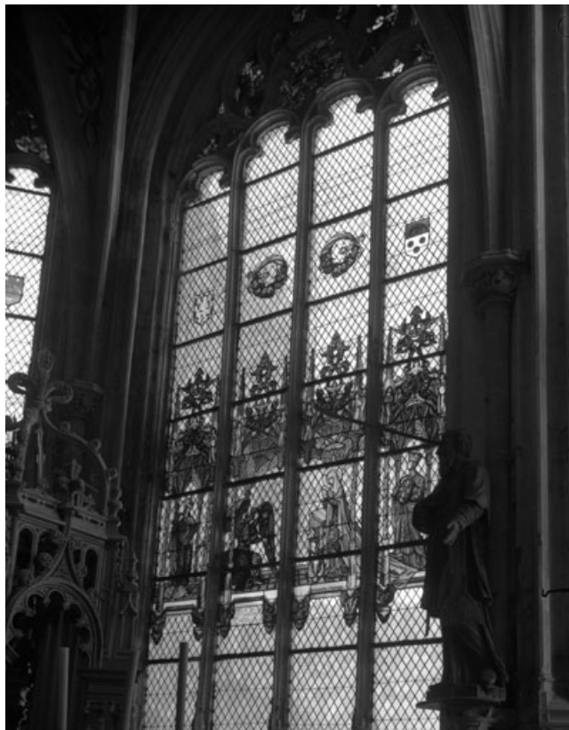
Baie 1 : saint Benoît, Apparition du Sacré-Coeur à Marguerite-Marie Alacoque, Jeanne d'Arc. 25, Montbenoît