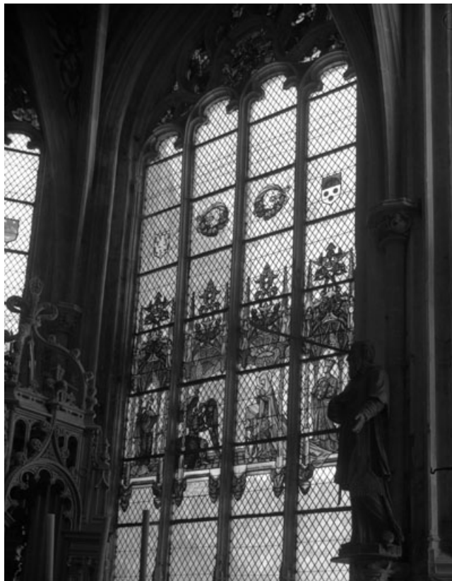
Baie 1 : saint Benoît, Apparition du Sacré-Coeur à Marguerite-Marie Alacoque, Jeanne d'Arc. 25, Montbenoît