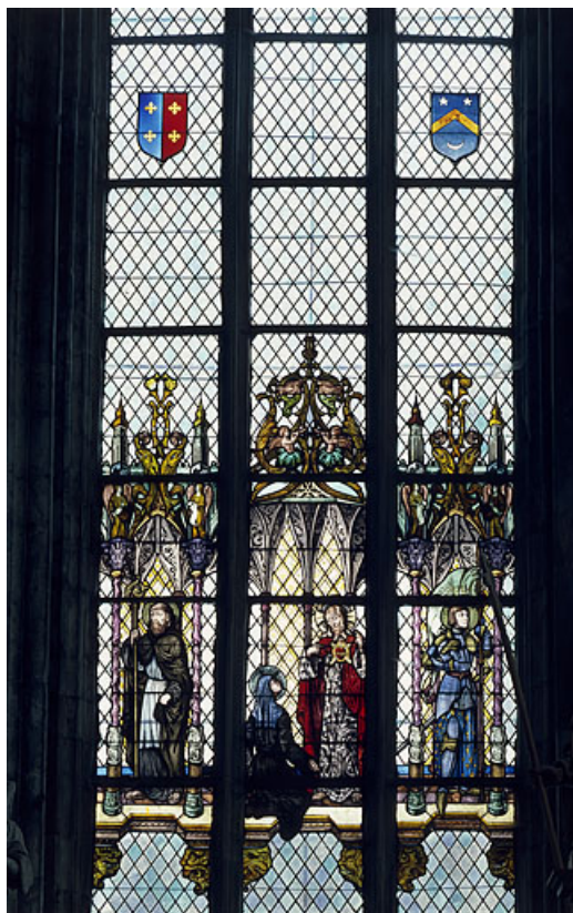
Baie 1 : saint Benoît, Apparition du Sacré-Coeur à Marguerite-Marie Alacoque, Jeanne d'Arc. 25, Montbenoît