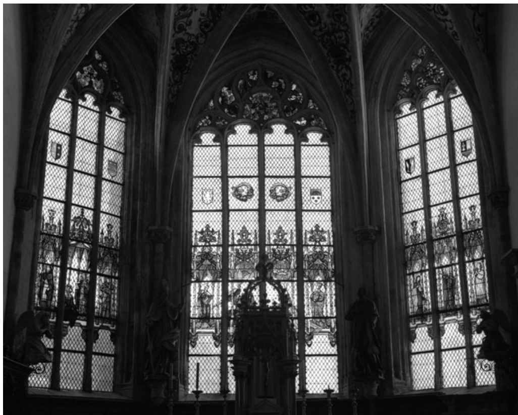
Vue d'ensemble des baies du chœur. 25, Montbenoît