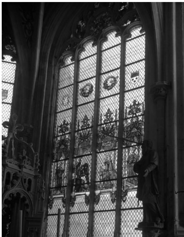
Baie 1 : saint Benoît, Apparition du Sacré-Coeur à Marguerite-Marie Alacoque, Jeanne d'Arc. 25, Montbenoît