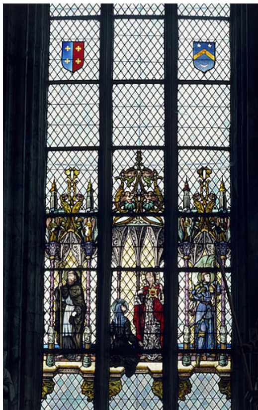
Baie 1 : saint Benoît, Apparition du Sacré-Coeur à Marguerite-Marie Alacoque, Jeanne d'Arc. 25, Montbenoît