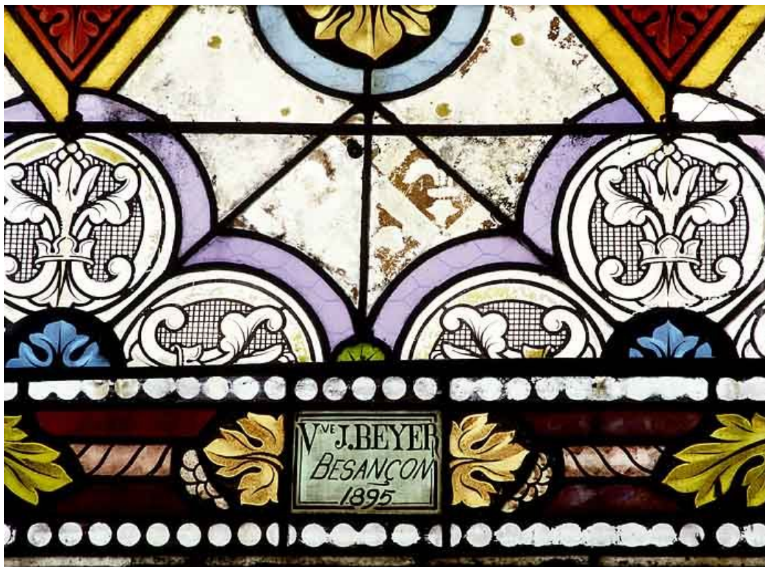
Détail : signature J. Beyer, Besançon, 1895. 25, Mercey-le-Grand