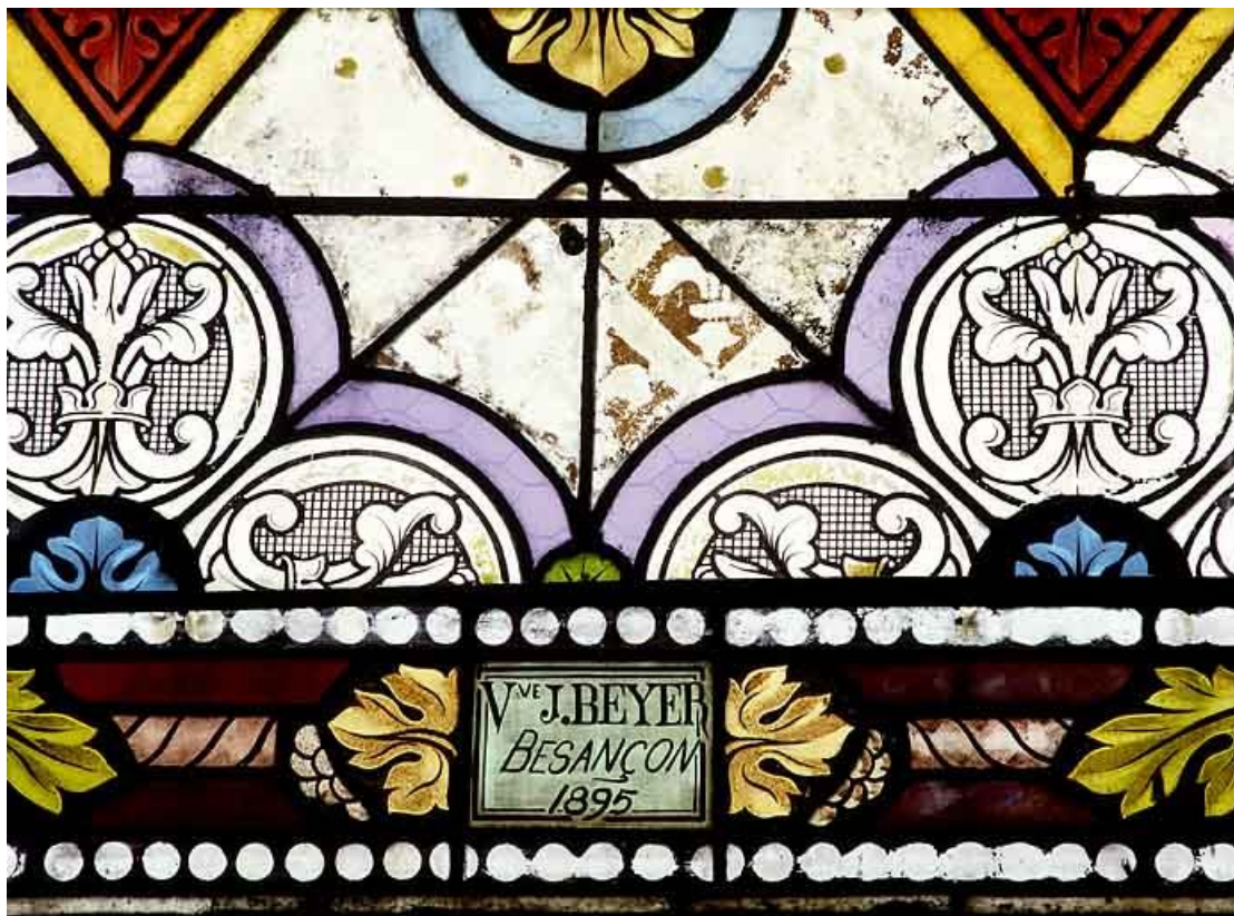
Détail : signature J. Beyer, Besançon, 1895. 25, Mercey-le-Grand