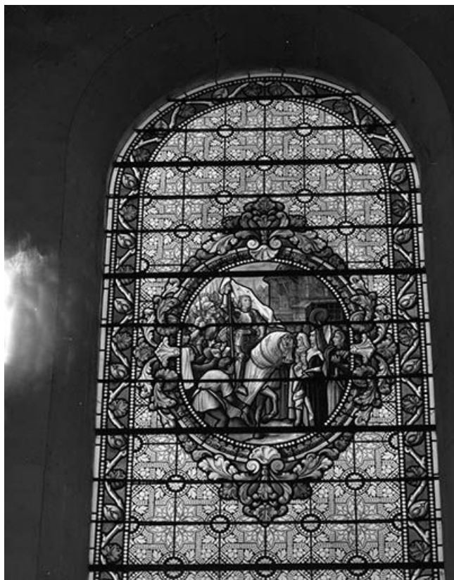
Baie 1 : sainte Jeanne d'Arc. 25, Lods