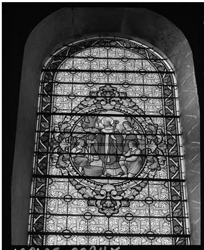
Baie 2 : saint Théodule.