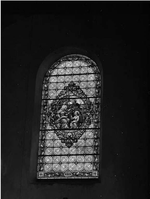
Baie 3 : Sainte Famille.