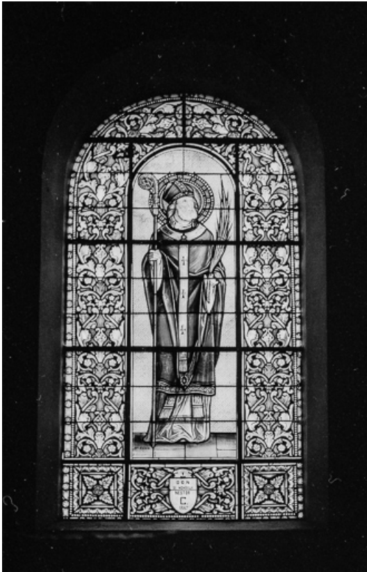
Baie 7 : saint Ferréol.