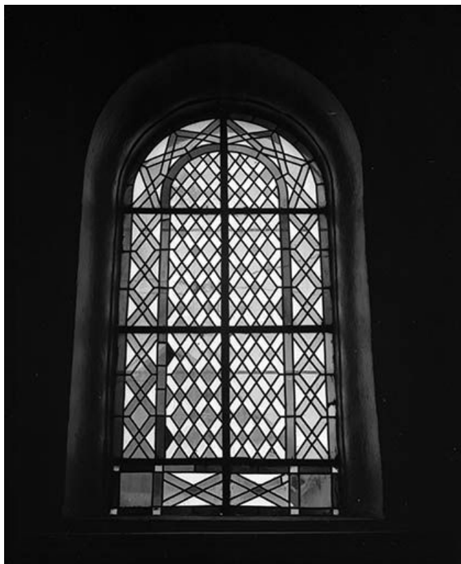
Baie n° 1.