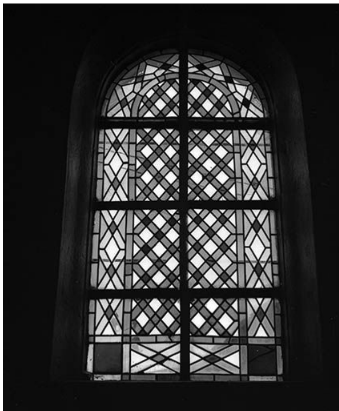
Baie n° 5.