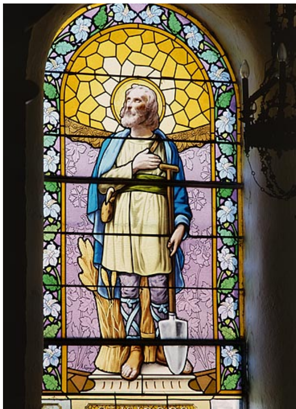
Baie 4 : saint Isidore 25, Les Grangettes