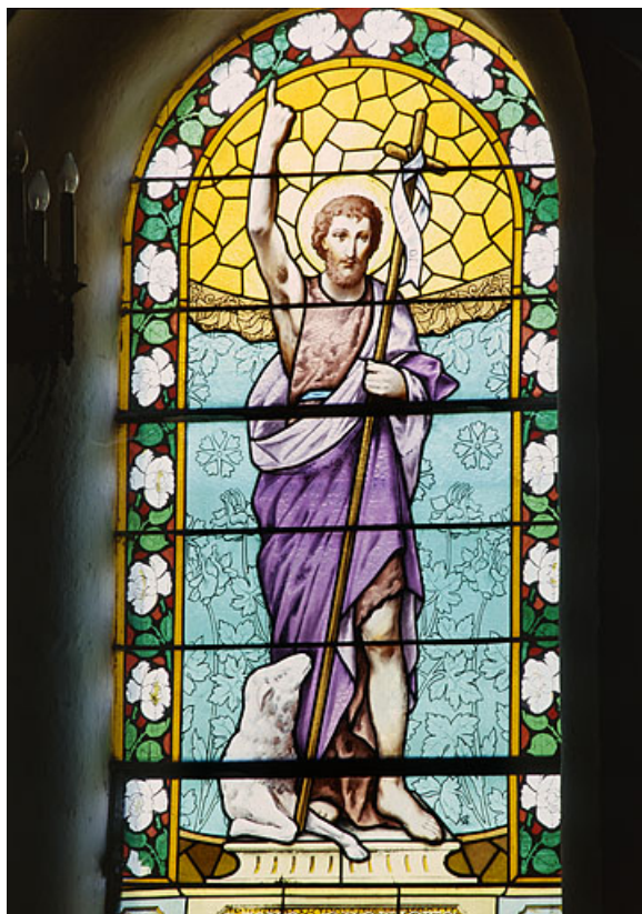
Baie 3 : saint Jean-Baptiste.