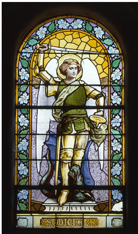
Baie 5 : saint Michel.