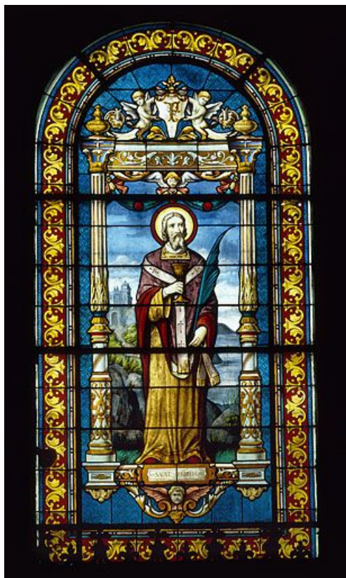
Baie 3 : saint Ferréol.