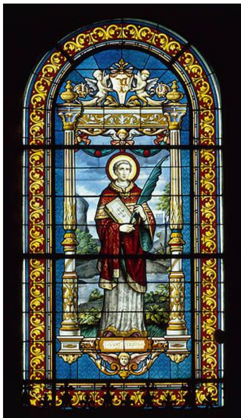
Baie 4 : saint Ferjeux.