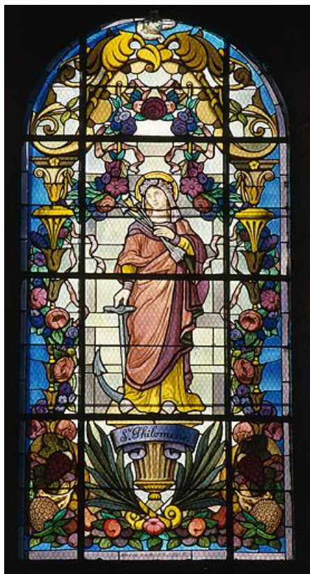
Baie 6 : sainte Philomène.