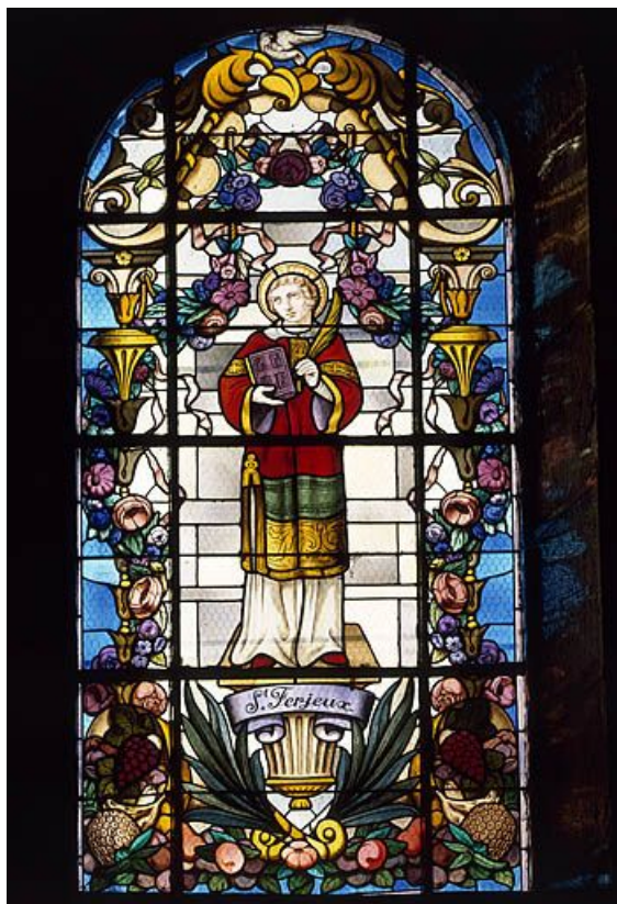
Baie 2 : saint Ferjeux.