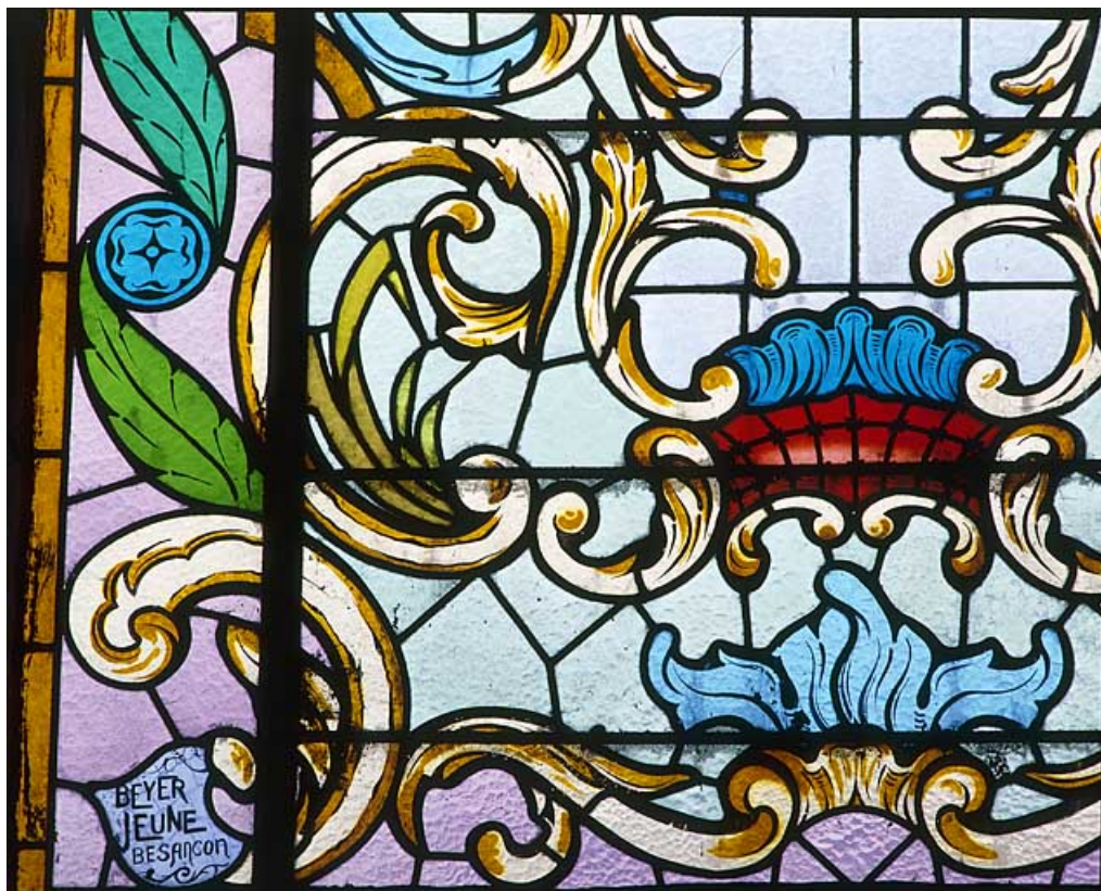
Détail : signature en angle Beyer Jeune. 25, Éternoz