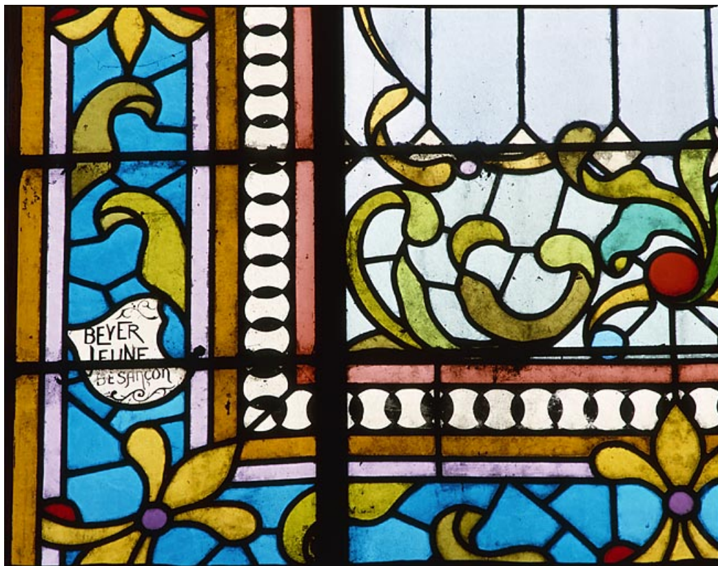
Détail : signature Beyer Jeune sur fond bleu. 25, Éternoz