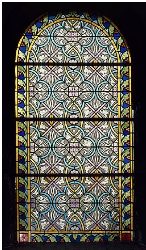
Baie 4 ou 5 : vue d'ensemble.